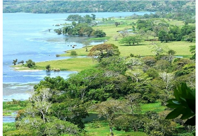
aan de oevers van het meer van Catemaco

dag 8: 's Morgens vroeg een vogelboottocht door