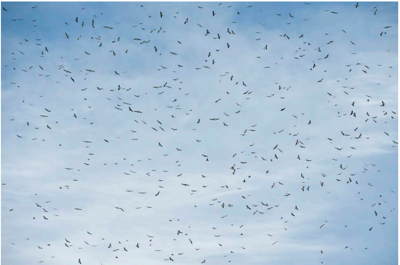
roofvogeltrek boven Cardel in Veracruz, Mexico

volop genieten van vogeltrek en tropische soorten 2018