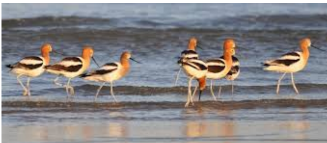
American Avocets, nog in zomerkleed

Voor specifieke en geheel vrijblijvende vogelinformatie en voor vragen over deze reis, kunt u terecht bij uw reisleader. Ook de uitgebreide Nederlands-Engelstalige vogellijst, met daarop de verwachte doelsoorten kan, geheel vrijblijvend, vooraf bij hem worden opgevraagd (als PDF, per e-mail).