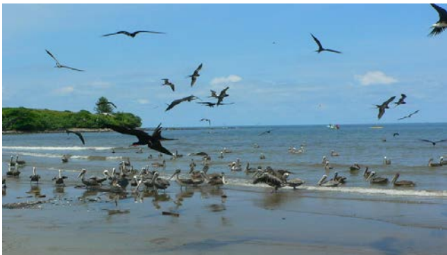
Brown Pelicans en Magnificent Frigatebirds bij Laguna Sontecomapan

Stichting Vogelreizen adviseert om o.m. het volgende mee te nemen: verrekijker (liefst vergroting van 10x of meer) en, indien in uw bezit, 'n telescoop!, zodat u zelf goede en gedetailleerde beelden kunt krijgen van de waargenomen vogels, camera/telelens, een goede vogelgids, kleding voor vooral warm weer, open wandelsandalen, wandelschoenen, zitmatje, drinkbeker, parapluie, zonnebrandmiddel, hoofddeksel en wekker.