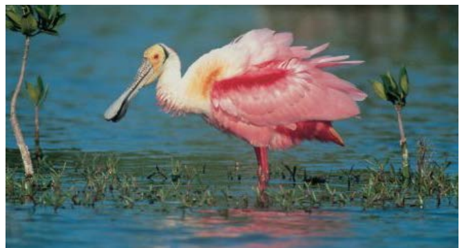
Roseate Spoonbill in Laguna La Mancha