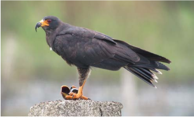
Snail Kite aan de maaltijd

en Yellow-tailed Oriole. We maken een natuurontdekkingstocht naar de gebieden rond het gehucht Ruiz Cortines én een veelbelovende boottocht in de Laguna Sontecomapan. Naast wel 4 soorten ijsvogels, maken we hier ook kans op de Sungrebe. Aan het einde van de reis keren we terug naar Cardel, om nogmaals te genieten van de 'River of Raptors'.