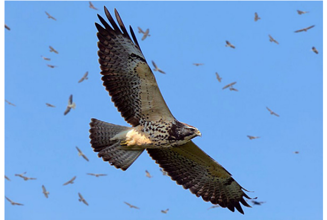
Swainsons Hawks bij Tlacotalpan

In het stadspark van Xalapa, gesitueerd op een gedoofde vulkaan, gaan we o.m. op zoek naar de endemische Blue Mockingbird. De Band-backed Wren is hier algemeen, evenals de Clay-coloured Thrush. Met wat geluk zien we de prachtige Green Jay. Een schitterende vlinder die hier veel voorkomt is de Glasvlinder (Greta oto). Zijn vleugels zijn vrijwel