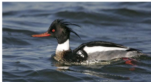
mannelijke Middelste Zaagbek in de Grevelingen

Een apart en vaak succesvol onderdeel van onze speciale delta-excursie is het bezoek aan de zeezijde van de Brouwersdam, tussen Goeree en Schouwen. Ruimschoots zullen we de tijd nemen om de zee af te speuren naar soorten die normaliter in Nederland niet zo gemakkelijk zijn aan te treffen. Daarbij gaat het om de vele Eidereenden, Zwarte en Grote Zee-eenden, Brilduikers en Middelste Zaagbekken, die de zee aan de buitenzijde van de dam plegen te bevolken. Tevens speuren we naar soorten als Roodkeelduiker, IJsduiker, Geoorde Fuut, Roodhalsfuut, Kuifduiker, Zeeoet, Zwarte Zeeoet, Alk en IJseend. Op het talud van de dam