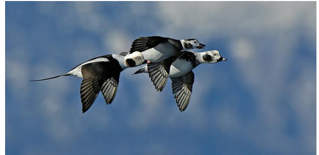
IJsenden in winterkleed vliegen langs de Brouwersdam