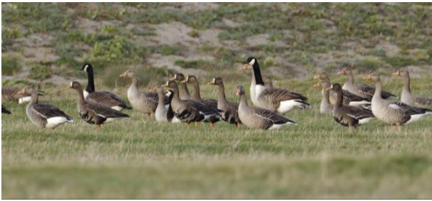
Canadese -, Grauwe - en Kolganzen mooi in beeld

houden zich vaak wel steltlopers op, waaronder Steenlopers en Paarse Strandlopers. Aan de binnenzijde van de Brouwersdam verblijven tijdens de wintermaanden meestal wel een paar Grote Sterns, een soort die hier sinds de jaren zeventig probeert te overwinteren. De excursieleiders zullen jou met genoeg meenemen naar het boeiende natuurgebied in ontwikkeling: De Prunje, langs de zuidkust van Schouwen. Dit gebied strekt zich uit van de Schelphoek tot bij Zierikzee. Gebruikmakend van oude krekken en kreekrelicten in het landschap, zal het 'Plan Tureluur' de Prunje qua structuur en ambiance terugbrengen naar het Schouwen van begin vorige eeuw. Het gaat om één van de meest omvangrijke en meest ambitieuze