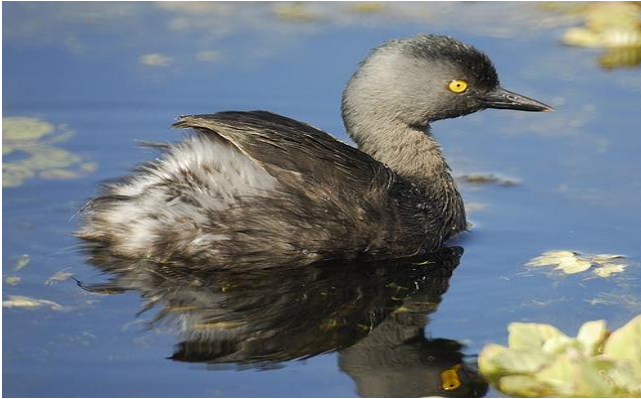
De altijd waakzame Least Grebe bij Dam Muizenberg, Curaçao

ontbijt, een vroege excursie plaats, 'alléén voor de liefhebbers'.