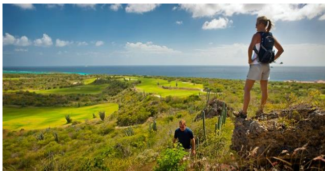
Landschap van Santa Barbara Plantation, Curaçao

De vogelwereld van 'onze' ABC-eilanden kenmerkt zich door fauna-elementen van het Zuid-Amerikaanse continent én van het Caribisch gebied. Omdat Aruba en Curaçao slechts 'n steenworp van Venezuela verwijderd liggen, komen op deze eilanden soorten voor, die verder in Zuid Amerika heel gewoon zijn: Neotropic Cormorant, White-tailed Hawk, Crested Bobwhite, Collared Plover, Southern Lapwing, Bare-eyed Pigeon, Ruby-topaz Hummingbird, Blue-tailed Emerald, Bananaquit en de prachtige Troupial. Maar de meeste eilandsoorten zijn toch echte Caribische vogels. Dat zijn vaak kust- en watergebonden soorten als Magnificent Frigatebird, Brown Pelican, maar liefst 10 ! reigersoorten (tijdens de 2013-reis werd de Least Bittern ontdekt: nieuw voor Aruba !), Caribbean Coot, American Skimmer, Laughing Gull en verschillende soorten steltlopers en zangvogels. Maar óók de Burrowing Owl en een op Aruba endemische ondersoort van de Brown-throated Parakeet. En er is nóg 'n element in de vogelwereld van deze mooie eilanden: gedurende ons verblijf tijdens de najaarstrek, vliegen namelijk diverse vogelsoorten van hun Noord-Amerikaanse broedgebieden, zuidwaarts naar en óver het Caribisch gebied. Enkele soorten boreale zangvogels (als Yellow Warbler, Blackpoll Warbler en Northern Waterthrush), roofvogels (zoals