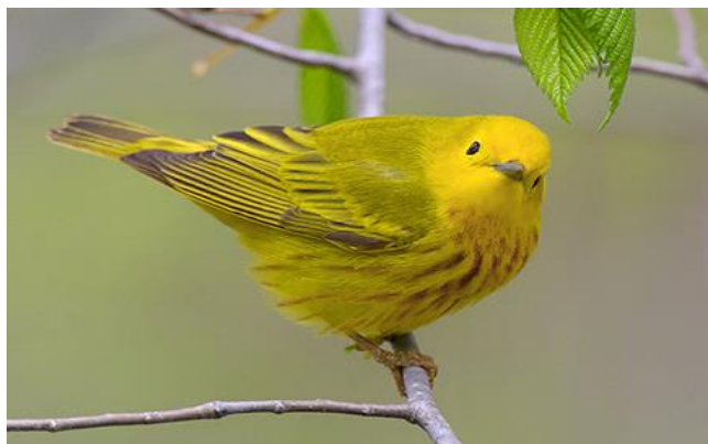
Yellow Warbler, landgoed Ascension, Curaçao

De landschappen van beide eilanden, zijn zonder meer afwisselend te noemen: mangrovegebieden, zoutpannen, stranden, rotskusten, heuvelachtige streken, lagunes,