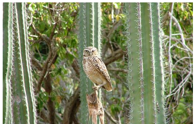
De Shoko, of Holenuil, is een schaarse broedvogel op Aruba