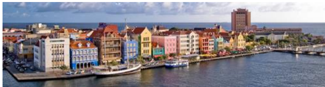
Handelskade in Willemstad, Curaçao, met rechts de Emmabrug (de beroemde 'pontjesbrug'). We gaan er 's avonds 'n keer naar toe!

We zien er, door de hogere vochtigheidsgraad, prachtig baardmos aan bomen en struiken groeien. In het aangrenzende National Park Sheta Boka ontmoeten we mogelijk zeeschildpadden en bij Sint Willibrordus is een natuurreservaat met o.m. flamingo's. Verder leven er op het eiland verschillende soorten hagedissen. De grootste