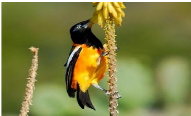
Karakteristieke vogel van beide eilanden: de Venezuelan Troupial

Grofweg kunnen er op dit eiland drie landschapstypen worden onderscheiden: het noordoostelijk gedeelte is sterk heuvelachtig, met als hoogste punt de Jamanota (189 m.). Hier ligt Arikok National Park. Het landschap bestaat uit vulkanisch materiaal en is doorsneden door rooien (droge rivierdalen). Arikok NP is vooral een landschapspark, waar we op zoek gaan naar vleermuizen, diverse soorten slangen, prehistorische rotstekeningen én natuurlijk vogels, zoals bij Boca Prins, Fontijn Cave en Cunucu.