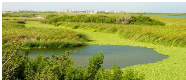
Perfect overzicht vanaf de uitkijktoren Bubali Bird Sanctuary, Aruba

Tijdens deze speciale natuur- en vogelreis is Emile Dirks reis leider. Hij is bekend met Aruba en Curaçao. In 2010 vond een voorbereidingsreis naar beide eilanden plaats, waarbij diverse Nationale Parken, natuurreservaten en andere hotspots werden geïnspecteerd en een nieuwe soort voor Aruba kon worden genoteerd. 2011 kende een succesvolle najaarsreis met zelfs 94 soorten, waaronder 2 dwaalgasten. De reis in 2013 leverde zo'n 90 vogelsoorten op, waarvan nota bene 2 nieuw voor het eiland Aruba!