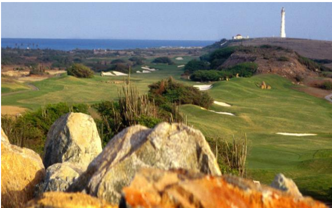
Fraai landschap van Tierra del Sol met California Lighthouse, Aruba

Stichting Vogelreizen adviseert om o.m. het volgende mee te nemen: verrekijker (liefst vergroting van 10x of meer),