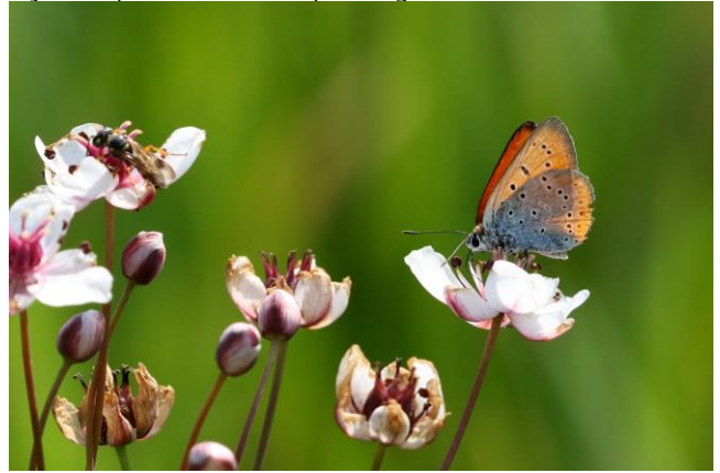
Grote Vuurvliender

niet minder fraaie vogels, zoals Scharrelaar, Hop, Bijeneter, Wielewaal en Sperwergrasmus.