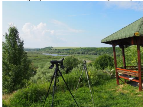
Lake Srebarna

Vandaag zullen we een vrij nieuw natuurgebied bezoeken wat, misschien wel om deze reden, in perfecte staat verkeert. Het is thuis voor veel interessante soorten zoals Witvleugel-, Zwarte- en Witwangsters, Roodhals-