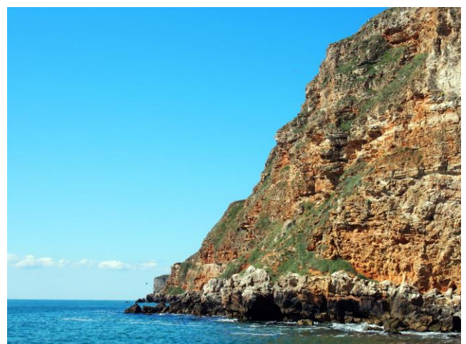
Kliffen bij Kaliakra.

Kaliakra (Bulgaars: Калиакра) is een lange en smalle landtong in de regio Zuid-Dobruja van de noordelijke Bulgaarse Zwarte Zeekust, op 12 km ten oosten van Kavarna en 60 km ten noordoosten van Varna. De kust is steil met verticale kliffen die vanaf een hoogte van 70 meter stijl naar de Zwarte Zee afdalen.