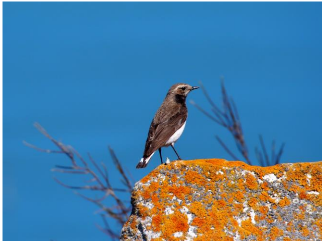
Bonte Tapuit (vrouw)

Vandaag zullen we de Donau rivier verlaten en ons verplaatsen naar het oosten van de noordelijke Zwarte Zee kust. Tijdens de trip zullen we meermaals stoppen om te vogelen. Soorten die we zullen proberen te zien zijn Zwartkoppogors, Ortolaan en Kleine Klapekster. Rond het middaguur bereiken we de kust en maken we kennis met het natuurgebied 'Kaliakra' en het rotsachtige ravijn genaamd Bolata. Cape Kaliakra Steppe Nature Reserve is een soort landtong. Zijn witte en rode kliffen dalen scherp af naar de zee, en zijn zeker 200 meter hoog. In het binnenland zien we boven de glooiende steppe Kalanderen en Kortte Leeuweriken. De biotoop is ook prima geschikt voor Isabel- en Bonte Tapuiten. We zien op de kleine struiken diverse klauwieren zoals de Kleine Klapekster en de Grauwe Klauwier. Maar ook Zwartkop- en- Grauwe Gorzen. Wij hopen ook de Rosse Spreeuw te vinden. Bolata is een rotsachtige kalksteen canyon met op de bodem een klein riviertje, wat na de vorming van een klein moeras, uiteindelijk uitmondt in een kleine baai. De rotswanden van de canyon zijn geperforeerd door een groot aantal grotten, die onderdak bieden aan vele zoogdieren, reptielen en vogels zoals de Oehoe bijvoorbeeld. In de late namiddag, zullen we arriveren in een hotel in de stad Kavarna voor 2 nachten.