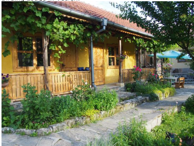
Pelican Lodge

Na de landing op het vliegveld van Boekarest vertrekken we voor een rit van 150 km naar het dorp Vetren (Bulgarije). Het dorp is gelegen in de onmiddellijke nabijheid van de rivier de Donau en het wereldberoemde reservaat 'Lake Srebarna'. Het is onder auspiciën van de UNESCO uitgeroepen tot cultureel en natuurlijk erfgoed. Afhankelijk van de tijd van onze aankomst kunnen we misschien een korte wandeling langs de rivier de Donau maken voor onze eerste waarnemingen in het gebied. We slapen deze en de volgende 3 nachten in de Pelican Birding Lodge in Vetren.