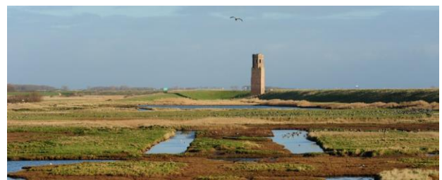
Dit bleef over van héél Koudekerke: de Plompe Toren