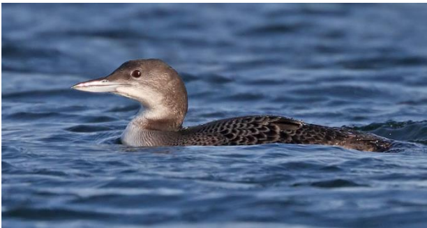
IJsduiker in winterkleed vanaf de Brouwersdam

Wie denkt aan wintervogels in het Deltagebied komt al gauw uit op: 'wilde ganzen'. Inderdaad, het lijkt er soms op dat in het winterhalfjaar de vogelwereld van de Zuid-Hollandse en Zeeuwse Eilanden wordt gedomineerd door ganzen. Maar naast de verschillende soorten ganzen kiezen veel méér vogelsoorten het Deltagebied als winterkwartier: roofvogels, kust- en zeevogels, eenden en steltlopers. En die proberen we sámen allemaal te ontdekken. Ga mee en geniet volop tijdens dit veelbelovende natuurweekend!