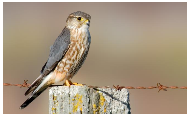
rustend Smelleken bij De Prunje

geluk en speurzinnigheid zullen we ook nog wat andere, zeldzamere ganzensoorten kunnen toevoegen aan de excursielijst van waargenomen vogelsoorten. Hierbij valt te denken aan Roodhalsgans, Kleine Rietgans of Sneeuwgans. Concentraties eenden en steltlopers trekken per definitie roofvogels aan, óók in het winterse zuidwest Nederland. We ontmoeten hopelijk: Zeearend, Smelleken, Slechtvalk en Blauwe Kiekendief. Verder is er een kans op o.m. Bruine Kiekendief, Sperwer, Buizerd, Havik en Velduil. Indien er tijd is voor de uitgestrekte Slikken van Flakkee, zullen we daar speuren naar Ruigpootbuizerds en heel veel andere mooie vogels.