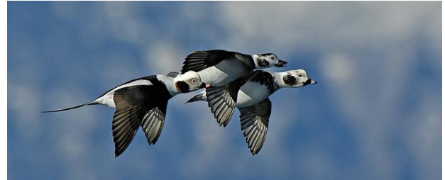
IJseenden in winterkleed vliegen langs de Brouwersdam