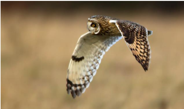
Er is altijd kans op een mooie Velduil . . .

houden zich vaak steltlopers op, waaronder Steenlopers en Paarse Strandlopers. Aan de binnenzijde van de Brouwersdam verblijven tijdens de wintermaanden meestal wel een paar Grote Sterns, een soort die hier sinds de jaren zeventig probeert te overwinteren. De excursieleiders zullen jou met genoeg óók meenemen naar het boeiende natuurgebied De Prunje, langs de zuidkust van Schouwen. Dit gebied strekt zich uit van de Schelphoek tot bij Zierikzee. Gebruikmakend van o.a. oude kreken en kreekrilicten in het landschap, heeft het 'Plan Tureluur' de Prunje qua structuur en ambiance terug gebracht naar het Schouwen van begin vorige eeuw. Het gaat om één van de meest omvangrijke en meest ambitieuze natuurontwikkelingsprojecten van