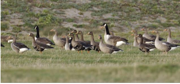
Canadese -, Grauwe - en Kolganzen mooi in beeld

houden zich vaak steltlopers op, waaronder Steenlopers en Paarse Strandlopers. Aan de binnenzijde van de Brouwersdam verblijven tijdens de wintermaanden meestal wel een paar Grote Sterns, een soort die hier sinds de jaren zeventig probeert te overwinteren. De excursieleiders zullen jou met genoeg óók meenemen naar het boeiende natuurgebied De Prunje, langs de zuidkust van Schouwen. Dit gebied strekt zich uit van de Schelphoek tot bij Zierikzee. Gebruikmakend van o.a. oude kreken en kreekrilicten in het landschap, heeft het 'Plan Tureluur' de Prunje qua structuur en ambiance terug gebracht naar het Schouwen van begin vorige eeuw. Het gaat om één van de meest omvangrijke en meest ambitieuze natuurontwikkelingsprojecten van