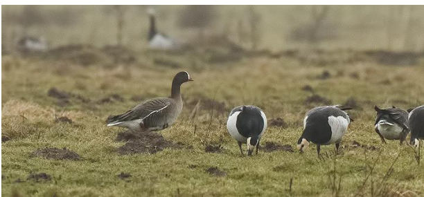
Dwerggans bij Strijen

In de dagen voorafgaand aan ons excursie-weekeinde zal worden vastgesteld op welke plaatsen veel te beleven valt, wat in belangrijke mate afhangt van de voedselsituatie voor vogels. Hierbij spelen weersomstandigheden een rol. Wij zullen de bekende locaties zoveel mogelijk aandoen. Dat betekent o.m.: speuren naar Dwergganzen in het Oudeland van Strijen, een belangrijke pleisterplaats voor deze soort. En dan naar de APL-polder bij Strijensas, eveneens gelegen in de Hoeksche Waard, waar mogelijk de Zeearend verblijft en natuurlijk veel watervogelsoorten. Daarna reizen we door naar Stellendam en de Brouwersdam. Op Schouwen-Duiveland, zal worden gedineerd en overnacht. De tweede dag brengen wij hoofdzakelijk op Schouwen-Duiveland op zoek naar o.a. Kleine Zwanen