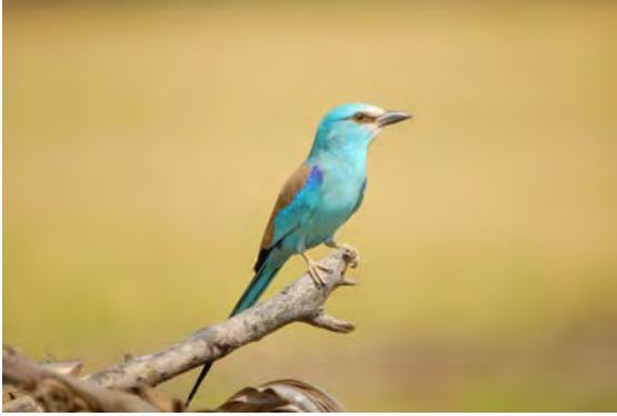
Sahel scharrelaar (Roelof Janssens)