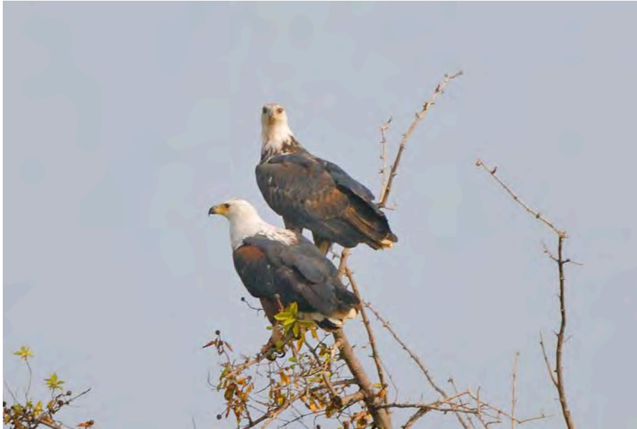
African Fish eagles