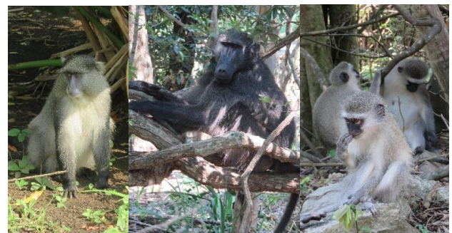
Alle drie de soorten apen komen aan bod: vlnr: Samango, Baviaan en Vervet Monkey (Emile Dirks)

's Avonds laat vertrekt ons vliegtuig naar Nederland. Op dag 16 komen we dan 's ochtends rond 10:00 op Schiphol aan.