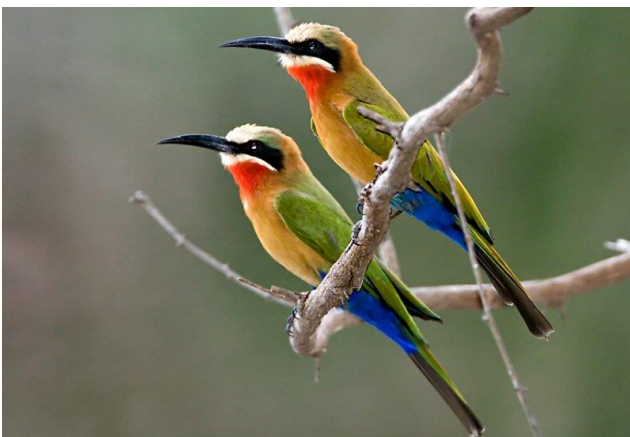
White-fronted Bee-eaters langs de Sabi-rivier

Om ons laatste hotel, bij de Paul Kruger Gate entree (zie kaartje van Kruger National Park) van het Kruger National Park, te bereiken, maken we na de lunch een rit van zo'n 100 km. We verblijven er vijf dagen. Feitelijk gezien staat ons luxe *****hotel één meter buiten dit geweldige natuurreservaat, met een magnifiek uitzicht óp dit gebied. Op dag 12 t/m 15 zijn we actief in het Kruger National Park zelf. We maken tijdens diverse tochten kans op ontmoetingen met Kudu, Giraffe, Impala, Olifant, Buffel, Bosbok, Wrattenzwijn, Baviaan, Zebra, Blauwe Gnoe, Gevlekte Hyena, Nyala en misschien Luipaard. Gelukkig kunnen we hier en daar de auto verlaten om in veilige en onder gewapende bewaking staande gebieden, natuur- en vogelwandelingen te maken. Vogelsoorten die we tegen kunnen komen, zijn o.a.: Reed Cormorant, Green-backed Heron, Yellow-billed, Saddle-billed en Marabou Stork, White-faced Whistling Duck, Bateleur, Dark Chanting Goshawk,