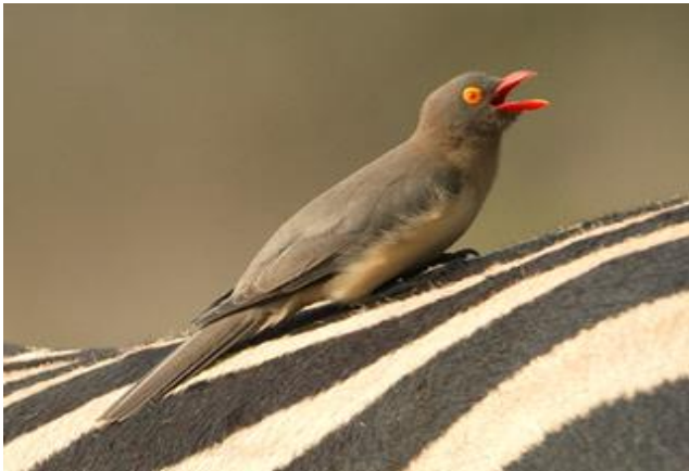
Red-billed Oxpecker bij Hilltop Camp, Hluhluwe Park

dag 7, 8 en 9: Saint Lucia (drie nachten) Twee uur na vertrek uit Hluhluwe iMfolozi Park komen we aan in ons fraai gelegen ***hotel in Saint Lucia. Van hieruit maken we o.a. 'n dagexcursie in het iSimangaliso Wetland Park (voorheen Greater St. Lucia Wetland Park). Deze World Heritage Site kent een grote