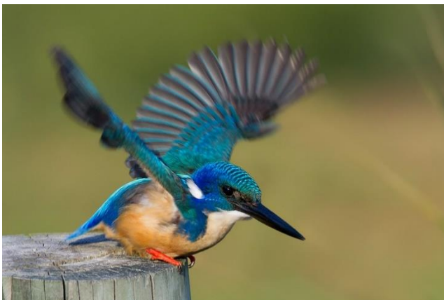
Half-collared Kingfisher, Hluhluwe Park

Met wat geluk kunnen we bij Cape Vidal, op enige afstand van de kust, walvissen zien zwemmen en zelfs uit het water zien 'jumpen'. Het zal ons evenmin ontbreken aan mooie vogelsoorten: Martial Eagle, Goliath Heron, Cape Gannet, Pink-backed en Great White Pelican, Indian Yellow-nosed Albatros, Three-banded Plover, Reuzenster, Thick-billed en Dark-backed Weaver, Huismus en Roodborsttapuit, Black-backed Puffback, African Pied en Cape Wagtail, Yellow-bellied Greenbul en de Pied Crow. Nijlpaarden (die 's avonds door de straten van Saint Lucia kunnen lopen) en Krokodillen kenmerken het waterlandschap van dit unieke gebied. In de