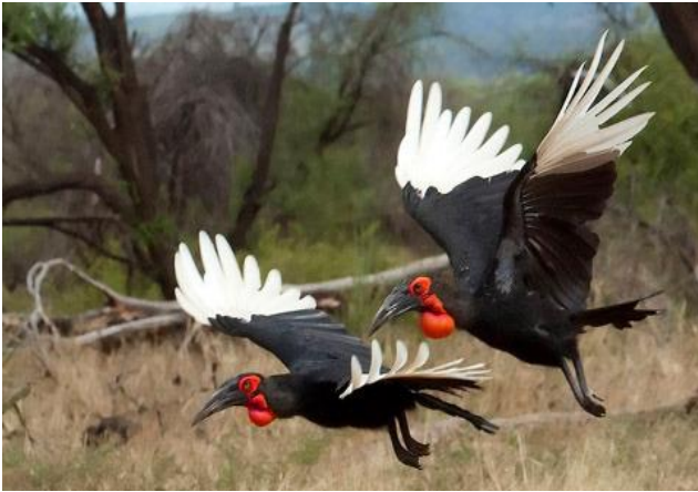
Bromvogels in Kruger NP

White-throated Robin-Chat. De Orange-Breasted Bush-Shrike, Grey-Headed Bush-Shrike, Tambourine Dove en Purple-crested Turaco behoren óók tot de kanshebbers! Uiteraard genieten we van de vele prachtige planten en bomen in dit reservaat. Houd je camera bij de hand!