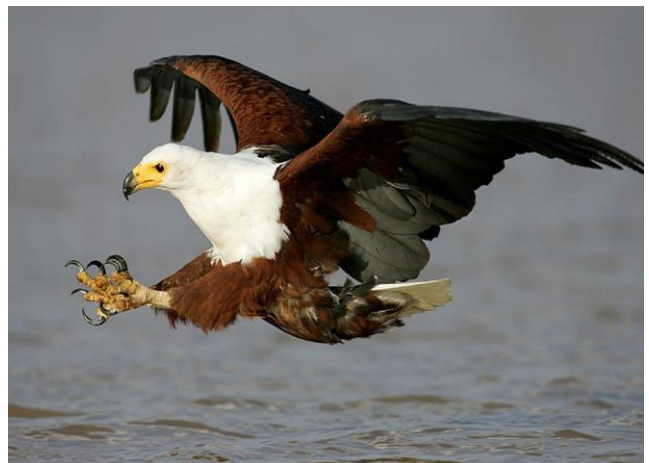
African Fish Eagle in actie op Lake Saint Lucia

Op dag 8 heb je een vrije dag: je kunt uitrusten van alle indrukken tot nu toe, of een excursie boeken bij een lokale agent. Mogelijkheden zijn o.a.: whale watching op de Indische Oceaan, een boottocht op het Saint Lucia Lake, een bezoek aan het Crocodile Centre of 'n Zululand Cultural Tour. Kijk voor meer info op: www.stluciasouthafrica.co.za