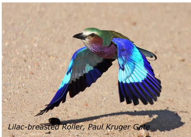
Lilac-breasted Roller, Paul Kruger Gate

's Ochtends vliegen we met de lijndienst van KLM van Amsterdam/Schiphol Airport in zo'n 11 uur rechtstreeks naar Johannesburg, Zuid-Afrika. Hier stappen we in onze minibus, die door de reisleader wordt bestuurd. We rijden naar ons vlakbij gelegen luxe hotel in Boksburg voor de eerste overnachting. Andere