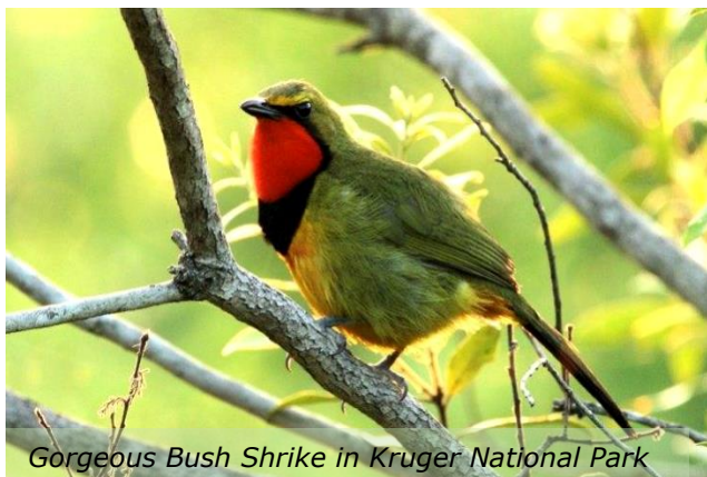
Gorgeous Bush Shrike in Kruger National Park

Z eker als je nog nooit in Zuid-Afrika bent geweest, gaat er een wereld voor je open, tijdens deze kennismakingsreis. In de Zuid-Afrikaanse vroege lente maken we een trektocht langs prachtige Nationale Parken en natuurrezervaten. Met eigenlijk een tweeledig doel: genieten van veel nieuwe, boeiende vogelsoorten en tegelijkertijd kennismaken met Afrikaans 'groot wild', zoals tijdens echte safari's. Die combinatie, vogels én groot wild, maakt onze reis tot een bijzondere. Tijdens onze natuurreis bezoeken we het noordoosten van dit immense land. Verschillende natuurrezervaten en Nationale Parken van naam en faam staan op het programma. Ook het wereldberoemde Kruger National Park ontbreekt uiteraard niet in de vogelsafari.