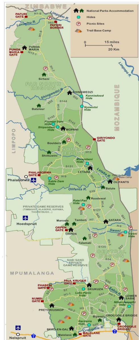
kaart van Kruger National Park