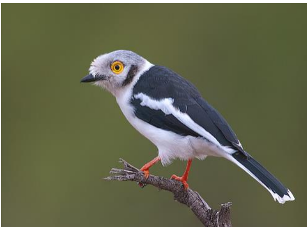
White-crested Helmet-shrike, Lower Sabi, KNP

dag 2 en 3: Wakkerstroom (twee nachten) We gaan op weg naar het dorpje Wakkerstroom, zo'n 5½ uur rijden naar het oosten. We verblijven in een eenvoudig hotel, wat ons de mogelijkheid geeft om 1½ dag op excursie te gaan door de vlaktes en langs de uitgestrekte rietlanden ten noorden van het dorpje. Het is belangrijk om te weten dat het dorp en de omgeving op een hoogte van zo'n 1770 m. liggen. In het Zuid-Afrikaanse vroege voorjaar is het er overdag nog fris. Andere reservaten en Nationale Parken, die we gedurende onze verdere 'ontdekkingsreis' bezoeken, kennen daarentegen hogere temperaturen, die variëren tussen de 19 en 27°C.