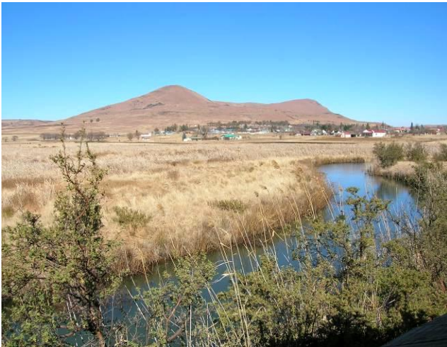
Wakkerstroom Reservoir op 1700 m. hoogte

zo nodig met de boeken er bij! We kunnen zo'n 250 vogelsoorten waarnemen. De vogelsafari is gericht op het verkrijgen van