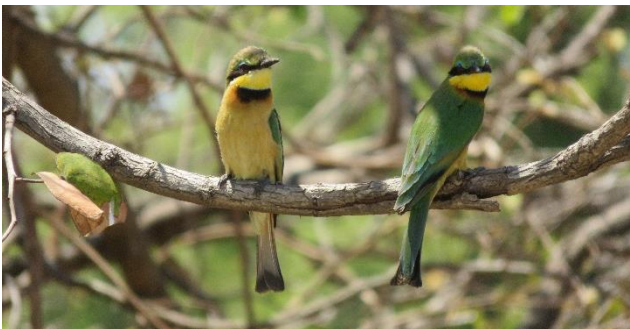
Kleine Bijeneters in Hluhluwe Park (Emile Dirks)

Boeking geschiedt door toezending van een volledig ingevuld boekingsformulier, alsmede door overmaking van 25% van de reissom (zie prijsbijlage), onder vermelding van de