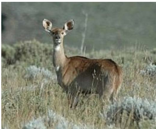
Mountain Nyala, vrouwtje

Voor het ontbijt vogelen in de tuin van het resort, waar we o.a. Eastern Grey Plantain-eater kunnen waarnemen. Daarna over hoog gelegen, open landbouwgebieden op weg richting Bale Mountains. Na Dodola beginnen we te klimmen en op een pas komt er ook wat meer bos. Bij Dinsho liggen interessante moerassen, waar we zeker een stop maken. De eerste Spot-breasted Plovers zouden gezien kunnen worden. Op een van de volgende dagen komen we er terug. In Goba nemen we ons intrek in het Wabe Shebelle hotel. Onderweg kans op: Thick-billed Raven (endeem), Somali Crow, Blue-winged Goose, Rouget's Rail, Spot-breasted Plover (endeem), Abyssinian Catbird, etc. etc.