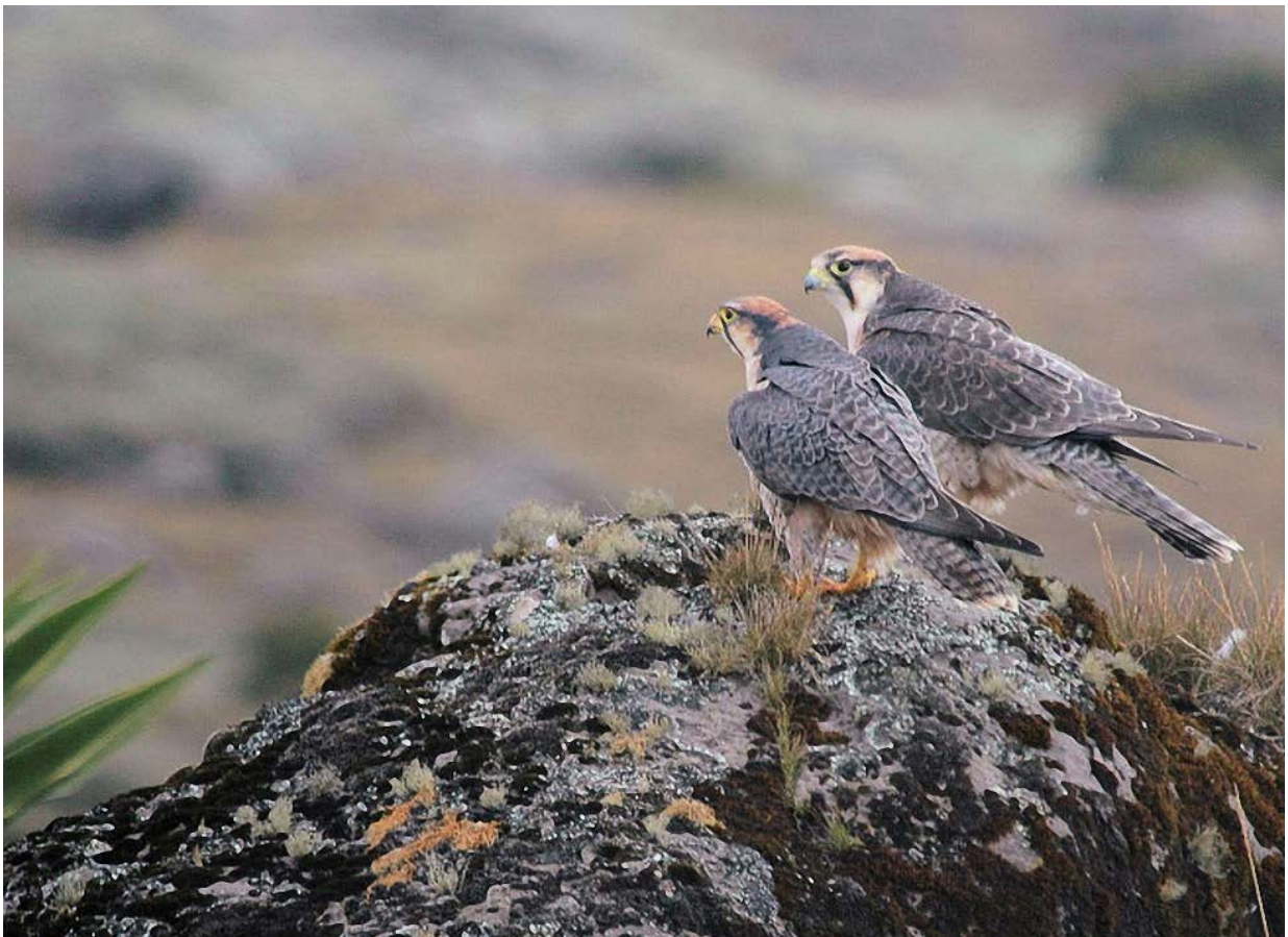
Paartje Lannervalken in Bale Mountains

morgens over de Solulta hoogvlakte ten noorden van Addis naar Debre Libanos. Bij een klooster ligt een mooi stukje bos tegen een steile helling met Banded Barbet, Abyssinian Woodpecker, Rüppels Black Chat, Ayre's Hawk Eagle, Lemon Dove, Dusky Flycatcher, White-cheeked Turaco, etc. We zien daar ook weer Gelada bavianen. En een spectaculair vergezicht over de canyons met Lammergeier, Verreaux's Eagle, Fan-tailed Raven, White-billed Starlings, etc. Voor wie in Addis Ababa wil blijven kunnen we een City-tour' organiseren. Terug in Addis Ababa dineren we nog in het hotel voor we naar het vliegveld vertrekken voor de nachtelijke terugvlucht.