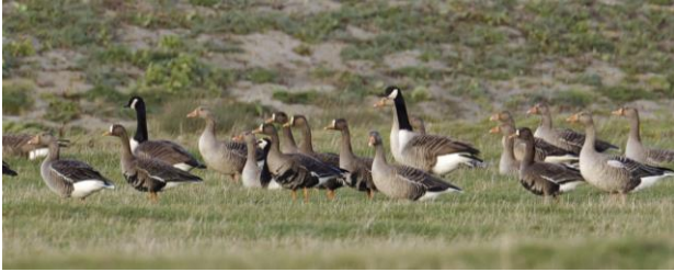
Canadese -, Grauwe - en Kolganzen mooi in beeld

vaak steltlopers op, waaronder Steenlopers en Paarse Strandlopers. Ook de Zeehond en de Grijs Zeehond zien we waarschijnlijk. Langs de Brouwersdam verblijven tijdens de wintermaanden meestal wel Grote Sterns, een soort die hier sinds de jaren zeventig probeert te overwinteren. De excursieleiders zullen jou met genoeg óók meenemen naar het boeiende natuurgebied De Prunje, langs de zuidkust van Schouwen. Dit gebied strekt zich uit van de Schelphoek tot bij Zierikzee. Gebruikmakend van o.a. oude krekken en kreekrelicten in het landschap, heeft het 'Plan Tureluur' de Prunje qua structuur en ambiance terug gebracht naar het Schouwen van begin vorige eeuw. Het gaat om één van de meest omvangrijke en meest ambitieuze natuurontwikkelingsprojecten van Nederland!