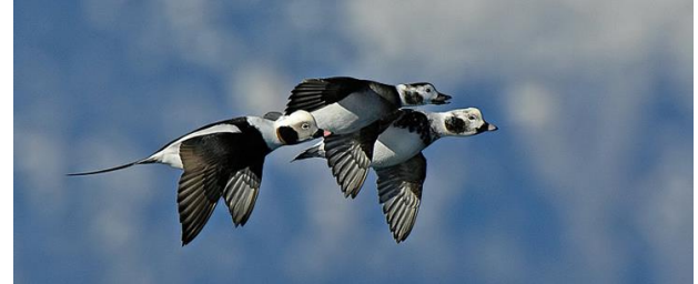
IJseenden in winterkleed vliegen langs de Brouwersdam