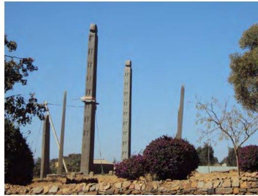
De obelisken van Aksum

Bij Debre Libanos kans op: Abyssinian Woodpecker, Lemon Dove, Ruppell's Chat, White-winged Cliff-chat, Ayres's Hawk-eagle, White-cheeked Turaco, Abyssinian Oriole, Crested Eagle, Lammergeier, etc. Na het diner dan naar Bole Airport voor de nachtvlucht terug naar Amsterdam.