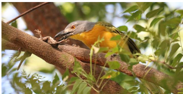
Grey-headed Bush Shrike met prooi (Emile Dirks, 2020)

elektriciteit, douche, deurslot, wc enz.). De staf van onze lodges is overigens graag bereid om zaken, vaak provisorisch, te verhelpen. Vergeet niet dat Gambia eigenlijk een straatarm derdewereldland is, met al heel veel jaren nauwelijks maatschappelijke ontwikkeling. Men heeft zelden oog voor zaken en details die door ons, westerlingen, als essentieel of vanzelfsprekend gezien worden. De keuze aan en kwaliteit en onderhoud van beschikbare verblijfsaccommodaties is zeer beperkt. Hou daar tijdens onze ontdekkingsreis rekening mee.