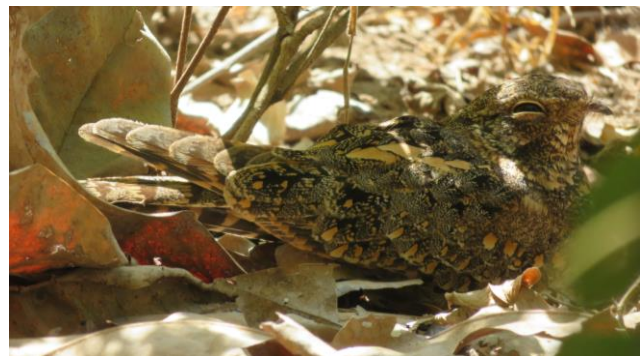
Long-tailed Nightjar (Emile Dirks, 2019)

dag 9 (overnachting 2/3): We bezoeken de Sapu-rijstvelden, waar het uitstekend vogelen is. Mogelijke vogelsoorten zijn o.a: de zeldzame Painted Snipe, Malachite Kingfisher, Intermediate Egret, honderden African Jacana's, Black Crake, Black-headed Plover, Zwarte Ruit, heel veel Kemphanen, Bosruiter, Grutto en Witgatje, veel Hamerkoppen en Ralreigers, Purperreiger, Verreaux's Eagle Owl, Western-banded Snake Eagle, Beaudoin's Snake Eagle, Greater Honeyguide, Roodkopkluuwier, Grey-headed Bush-shrike, Brubru, Green Wood-hoopoe, Kap- en Witruggier en Yellow-throated Leaflove.