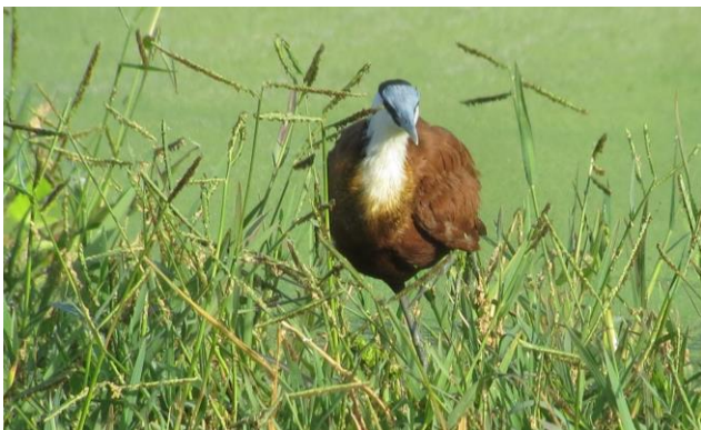
De African Jacana zien we vaak (Emile Dirks, 2012)

dag 4 (overnachting 1 van 4 in Tendaba): Reisdag naar Tendaba met uitgebreide stop in het interessante Farasuto Forest Community Nature Reserve. Ook brengen we een bezoek aan het even verderop gelegen Pirang Forest Park. Deze prachtige oude bosgebieden zijn relictten van wat eens de oorspronkelijke vegetatie vormde van grote