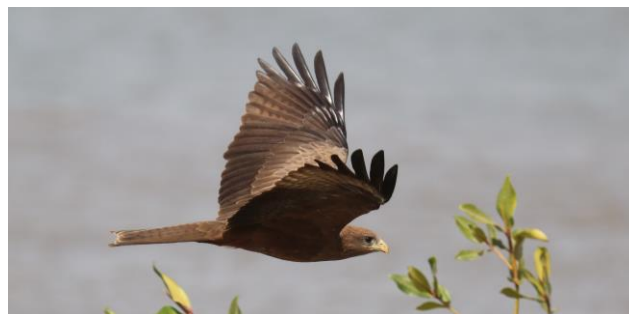
Foeragerende Geelsnavelwouw

Ons dagprogramma is onder voorbehoud en afhankelijk van vliegtijden en lokale omstandigheden. Kleine programma-aanpassingen zijn hierdoor mogelijk. Ontbijt is meestal om 07:00 uur en de avondmaaltijd gebruiken we rond 19:30 uur. 's Avonds vullen we 'met de liefhebbers' de vogellijst in, met uiteraard aandacht voor alle 'andere dieren'.