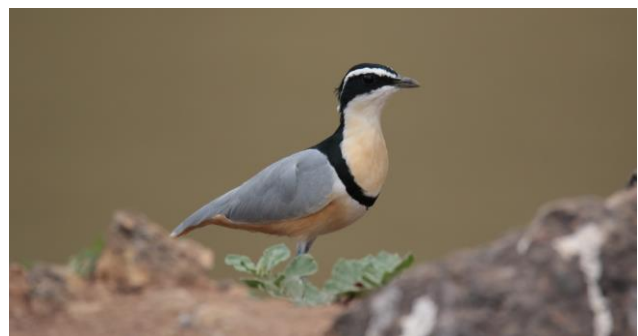
Egyptian Plover, Krokodilwachter (Ruud Fuik, 2019)

van het land. Het rivierdal is vlak en op veel plaatsen moerassig en heeft in de benedenloop een brakke, kleiachtige bodem. Er zijn zowel gras- als boomsavannen en, vooral langs de rivier, enkele overblijfselen van tropisch moessonwoud. In de zuidwestelijke kuststreek en langs de benedenloop van de rivier komen moerassen en mangrovebossen voor, de noordelijkste van het Afrikaanse continent. Ondanks het feit dat Gambia maar een klein land is, vertoeven er ruim 500 vogelsoorten. De meeste behoren tot de inheemse Afrikaanse avifauna. Een groot deel van deze vogels kan worden geobserveerd binnen relatief korte excursieafstand van onze diverse verblijfsaccommodaties.