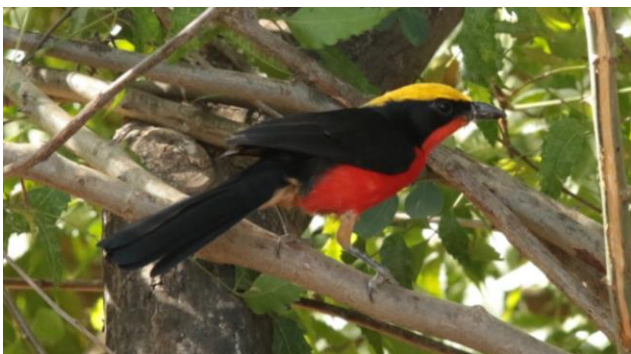
Yellow-crowned Gonolek (Ruud Fuik, 2019)

Middelste Jager, Visarend, Red-eyed Dove, Senegal Coucal, Abyssinian Roller, Common Bulbul, Bearded en Vieillot's Barbet, Brown Babbler en de prachtig gekleurde Yellow-crowned Gonolek.