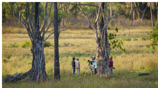
Op zoek naar de Pearl-spotted Owlet (Ruud Fuik, 2019)

dag 5 (overnachting 2/4 in Tendaba): 's Ochtends maken we een prachtige boottocht aan de overzijde van de Gambiarivier, in het krekengebied van Bao Bolong Wetland Reserve. 's Middags maken we een wandelexcursie door Kiang West National Park, aan