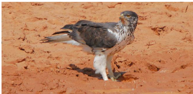
African Hawk Eagle (Roelof Janssens, 2017)

Gedurende de vele reizen die Stichting Vogelreizen in de voorbije jaren naar Gambia organiseerde