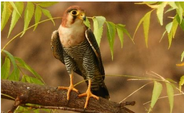
Red-necked Falcon (Hans Hofstede, 2019)

dag 11 (overnachting 1/2 in Kassagne): Vertrek uit Janjanbureh. We vervolgen onze Afrikaanse ontdekkingsreis met diverse stops onderweg. De gebieden die we aandoen zijn goed voor o.a. Black Crane, Chestnut-backed Sparrowlark, Purperkoet, Vorkstaartplevier, Loodbekje, Sudan Golden Sparrow, Black-crowned Sparrow-lark, Fine-spotted en Brown-backed Woodpecker, Exclamatory Paradise Whydah en Herdersplevier. Ook ontdekken we ongetwijfeld verschillende stern- en reigersoorten: Lachstern, Witwangstern, Zwarte en Zwartkopreiger. Een grote variëteit aan steltlopers is er te vinden. Natuurlijk stoppen we eveneens op andere plaatsen langs de route, afhankelijk van het vogelaanbod. We overnachten in de, door Nederlanders gerunde, fraaie AbCa's Creek Lodge, bij Kassagne. Deze accommodatie is mooi gelegen in de natuur, aan een zijtak van de Bitang Bolon, een zijriviertje van de machtige, brede Gambiarivier.