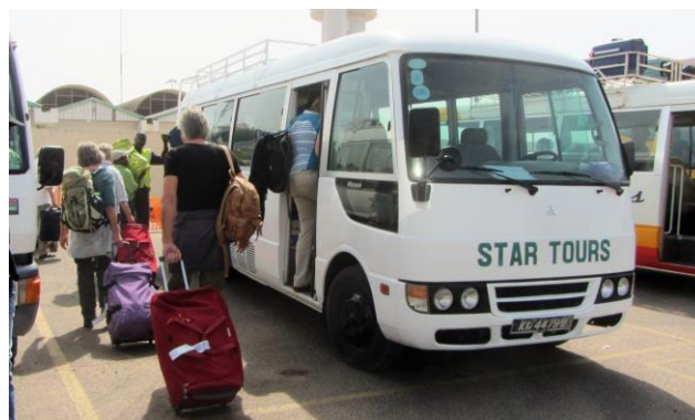
Onze royale 16-persoons bus (Marja de Vries, 2020)

dag 13: Na het ontbijt is er tot vertrek (11:00 uur, afhankelijk van vluchtschema) naar het vliegveld, gelegenheid om zelf nog iets te ondernemen op of rond het terrein van onze Lodge. Op weg naar het vliegveld brengen we een kort bezoek aan een markt waar handwerkslieden met een beperking hun producten aanbieden. Gedurende onze reis bezoeken we ook 'n keer een lokale markt; op welke dag dat gaat plaats vinden is nog niet bekend.