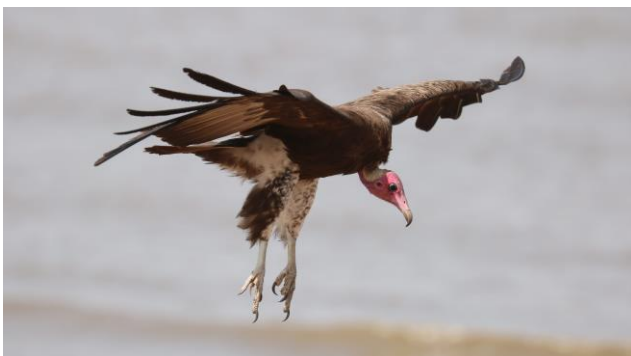
Een Kagpier stijkt bij ons neer (Emile Dirks, 2020)

Duck, Spur-winged Goose, Hadeda Ibis, African Fish Eagle, Shikra, Bruce's Green Pigeon, African Green Pigeon, Namaqua Dove, Grey-headed Kingfisher, Swamp Flycatcher, Pearl-spotted Owlet, Hoopoe, Blue-bellied Roller en White-throated Bee-eaters. Misschien ontdekken we de zeldzame Lappet-faced Vulture, of de White-backed en de Rüppell's Vulture. Indien de tijd het toelaat gaan we, na de boottocht, nog even op bezoek bij de steencirkels van Wassu, die op de Werelderfgoedlijst van UNESCO staan; entreprijs niet inbegrepen. Met onze bus gaan we terug naar Janjanbureh/Georgetown.