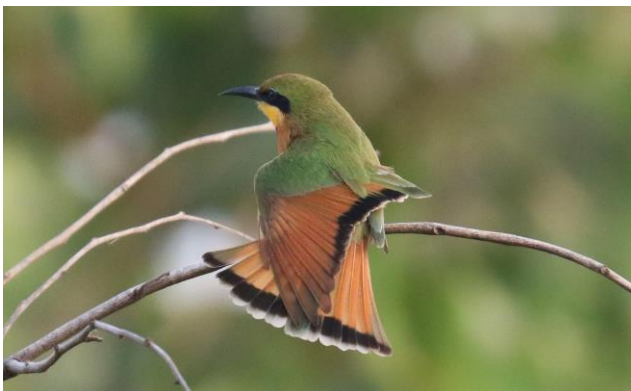
Kleine Bijeneter (Emile Dirks, 2020)

dag 8 (nacht 1/3 in Janjanbureh/Georgetown): Vervolg van onze ontdekkingsreis oostwaarts, naar Janjanbureh. Het is een reisdag met veel nieuwe vogelsoorten. Over de nieuwe brug bij Soma, steken we de Gambiarivier over naar Farafenni en gaan verder oostwaarts. We passeren diverse kleine en grotere natuurgebieden, voornamelijk wetlands: Kaur, Njau, Panchang en Chalen. Het is niet uit te sluiten dat we vandaag ontdekken: Europese en Afrikaanse Lepelaar, Yellow-billed Stork, Knob-billed Duck, Lachstern, Reuzenstern, de zeldzame Witkopgier, Krokodilwachter, Piapiac, Vorkstaartplevier, Gele Kwikstaart, Splendid en Scarlet-chested Sunbird, Geelsnavelossenpikker, Huismus en Bosmus. Verder kunnen we vandaag soorten aantreffen als Northern Anteater Chat, Black-bellied Bustard, Broad-billed Roller, Grasshopper Buzzard, Roodkeel- en overwinterende Europese Bijeneters.