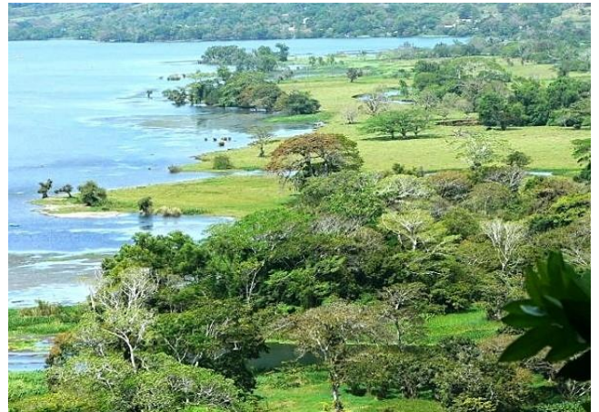
aan de oevers van het meer van Catemaco

dag 8: 's Morgens vroeg een vogelboottocht door de wetlands van Alvarado en 's middags naar het Mexicaanse Zwitserland, 'Los Tuxtlas'. Hier zullen