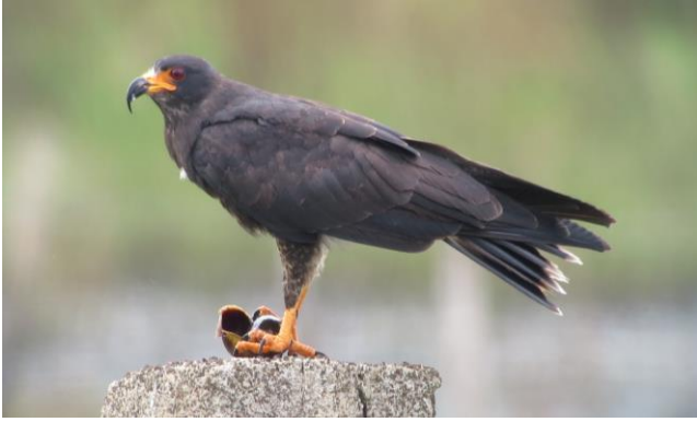
Snail Kite aan de maaltijd

We maken een natuurontdekkingstocht naar de gebieden rond het gehucht Ruiz Cortines én een veelbelovende boottocht in de Laguna Sontecomapan. Naast wel 4 soorten ijsvogels, maken we hier ook kans op de Sungrebe. Aan het einde van de reis keren we terug naar Cardel, om nogmaals te genieten van de indrukwekkende 'River of Raptors'.