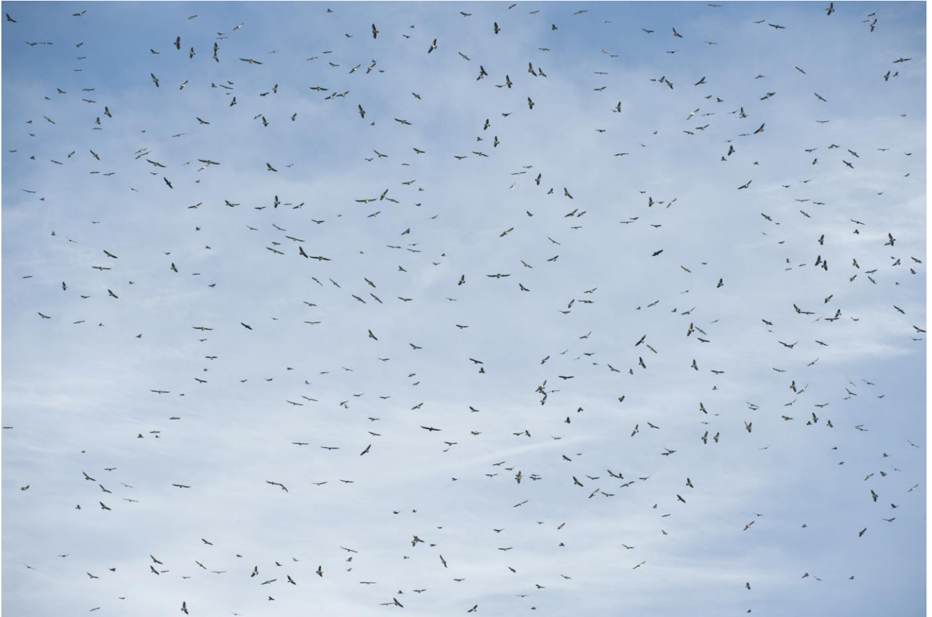
immense, voortdurende roofvogeltrek boven Cardel, Veracruz, Mexico

V ogeltrek fascineert. Plaatsen als Eilat, Falsterbo, de Bosporus en Batumi zijn 'n Mekka voor hen die massale trek willen meemaken. Maar ook in de nieuwe wereld is dit fenomeen te zien. Misschien wel de beste plek op onze planeet om gestuwde migratie van (roof-)vogels te beleven bevindt zich in de staat Veracruz, in Mexico.