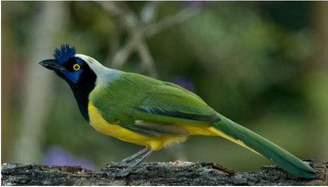
Green Jay in de buurt van Xalapa

We verblijven gedurende het eerste gedeelte van onze reis in een hotel langs de kust, waar 's ochtends intensieve trek is van o.a. White-winged Doves en Scissor-tailed Flycatchers. En óók: migrerende Visarenden, Magnificent Frigatebirds, White Pelicans, Anhinga's, Woodstorks, White-faced Ibises en véél, véél meer. Naast deze indrukwekkende mega-vogeltrek, waar we ruim tijd voor vrijmaken, bestaat de reis nog uit drie andere delen.