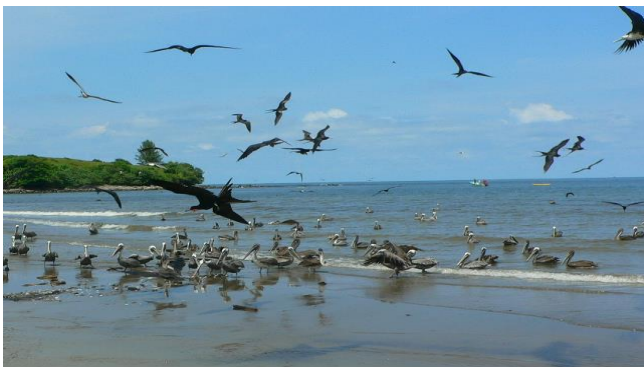
Brown Pelicans en Magnificent Frigatebirds bij Laguna Sontecomapan

Stichting Vogelreizen adviseert om o.m. het volgende mee te nemen: verrekijker en, indien in uw bezit, 'n telescoop!, zodat u zelf goede en gedetailleerde beelden kunt krijgen van de waargenomen vogels, camera/telelens, een goede vogelgids, kleding voor vooral warm weer, open wandelsandalen, wandelschoenen, zitmatje, drinkbeker, parapluutje, zonnebrandmiddel, hoofddeksel en mobiele telefoon.