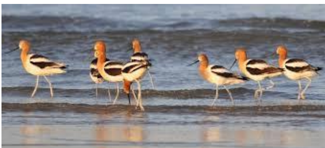
American Avocets, nog in zomerkleed

Voor specifieke en geheel vrijblijvende vogelinformatie en voor vragen over deze reis, kunt u terecht bij de reisleader. Ook de uitgebreide Nederlands-Engelstalige vogellijst, met daarop de verwachte doelsoorten kan, geheel vrijblijvend, vooraf bij hem worden opgevraagd (als PDF, per e-mail).