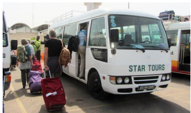
Onze royale 16-persoons bus (Marja de Vries, 2020)

dag 13: Na het ontbijt is er tot vertrek (11:00 uur, afhankelijk van vluchtschema) naar het vliegveld, gelegenheid om zelf nog iets te ondernemen op of rond het terrein van onze Lodge. Op weg naar het vliegveld brengen we een kort bezoek aan een markt waar handwerkslieden met een beperking hun producten aanbieden. Gedurende onze reis bezoeken we ook 'n keer een lokale markt; op welke dag dat gaat plaats vinden is nog niet bekend.