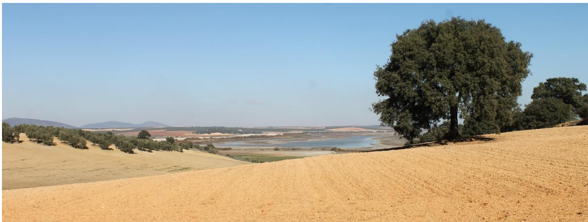
Zuid-Spaanse landschap met Laguna Fuente de Piedra