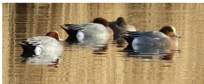
Smienten op het Heerenven

Ook kunnen in beeld komen: Roodborsttapuit, Blauwborst, Geelgors, Gekraagde Roodstaart, Fitis, Tjiftjaf, Boompieper, Veldleeuwerik en mogelijk zelfs Appelvink, Zwarte Specht, Kuifmees óf Boomleeuwerik. Ook IJsvogel en Klapekster mogen we op voorhand niet uitsluiten . . . Op het Heerenven-Zuid zijn diverse soorten eenden aanwezig, sommige nog als wintergast: Kuifeend, Wintertaling, Krakeend en Smient. Steltlopers op doortrek, zoals Tureluur, Groenpootruiter en Oeverloper zijn mogelijk. En Ooievaar en zelfs een Flamingo behoren tot de kanshebbers. Het aantal vogelsoorten lag in het verleden meestal rond de 80! Ga je mee op ontdekkingstocht?