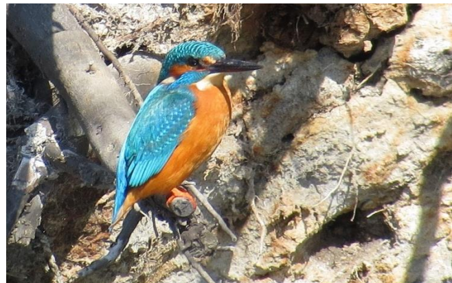
'n IJsvogel behoort tot de mogelijkheden

Ook kunnen in beeld komen: Roodborsttapuit, Blauwborst, Geelgors, Gekraagde Roodstaart, Fitis, Tjiftjaf, Boompieper, Veldleeuwerik en mogelijk zelfs Appelvink, Zwarte Specht, Kuifmees óf Boomleeuwerik. Ook IJsvogel en Klapekster mogen we op voorhand niet uitsluiten . . . Op het Heerenven-Zuid zijn diverse soorten eenden aanwezig, sommige nog als wintergast: Kuifeend, Wintertaling, Krakeend en Smient. Steltlopers op doortrek, zoals Tureluur, Groenpootruiter en Oeverloper zijn mogelijk. En Ooievaar en zelfs een Flamingo behoren tot de kanshebbers. Het aantal vogelsoorten lag in het verleden meestal rond de 80! Ga je mee op ontdekkingstocht?