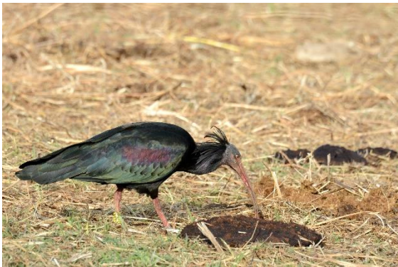
Heremiet- of Kaalkopibis

's-Avonds vieren we de bonte avond in Tarifa.