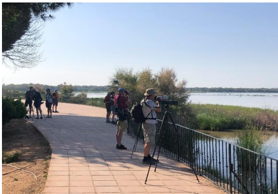
Vogelboulevard El Rocio

In El Rocio checken we in bij het hotel, waar we drie overnachtingen maken.