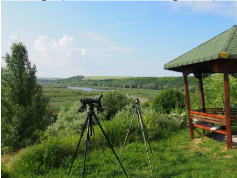
Lake Srebarna

Vandaag zullen we een vrij nieuw natuurgebied bezoeken wat, misschien wel om deze reden, in perfecte staat verkeert. Het is thuis voor veel interessante soorten zoals Witvleugel-, Zwarte- en Witwangsterns, Roodhals-