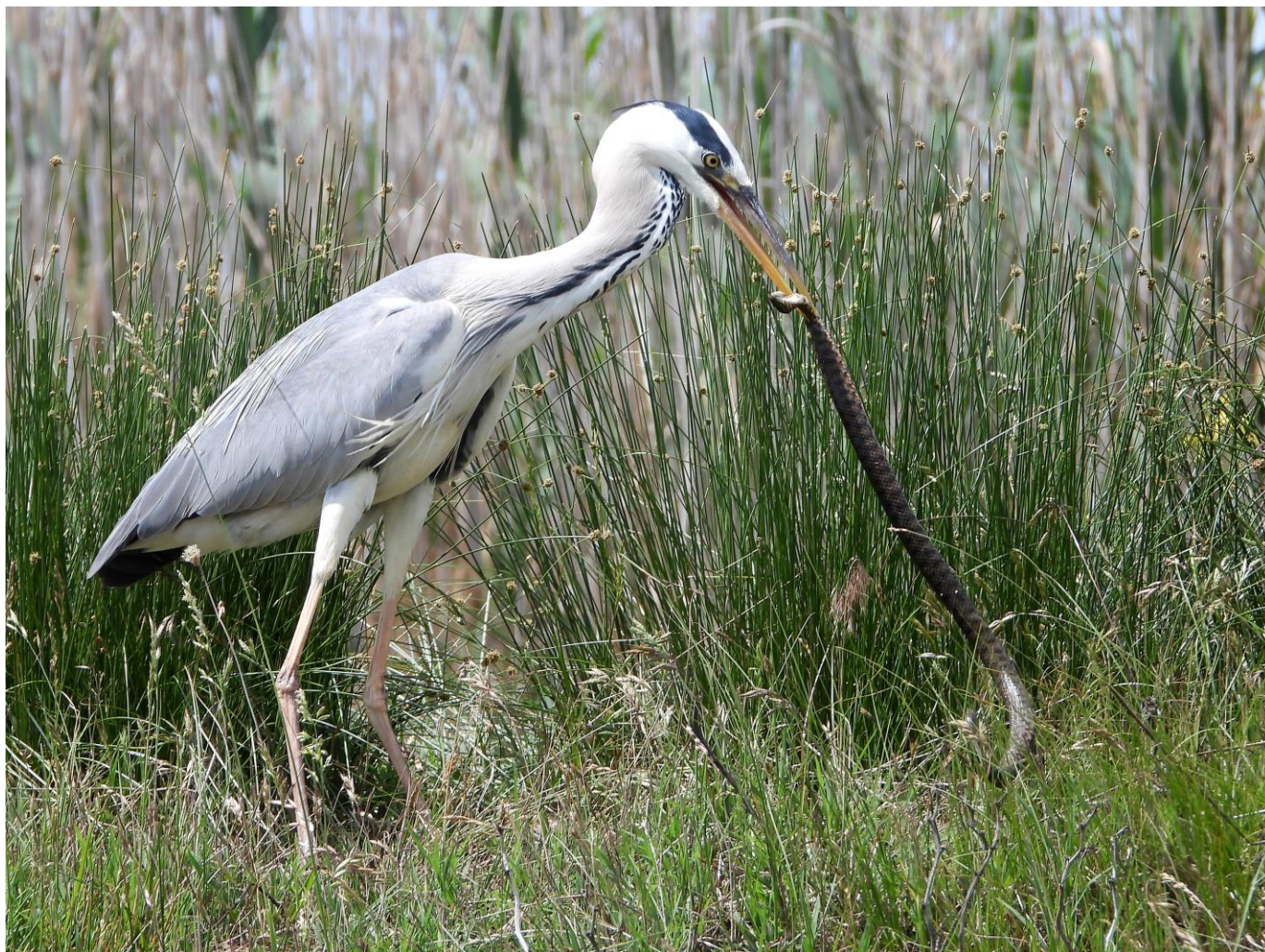
Foto: Blauwe Reiger met Dobbelsteenslang tijdens de reis van 2022