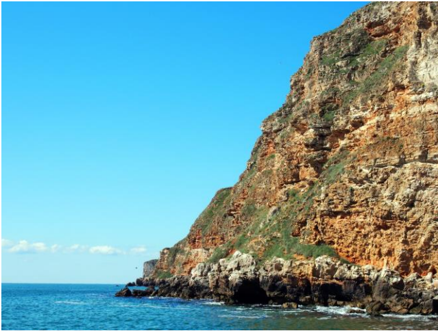
Kliffen bij Kaliakra.

Kaliakra is een natuurreservaat, waar ook dolfijnen en aalscholvers kunnen worden waargenomen. Het ligt aan de Via Pontica, een belangrijke vogeltrekroute uit Afrika naar Oost- en Noord-Europa. Veel zeldzame doortrekkers zijn hier te zien in de lente en de herfst. Ook is deze kust de thuisbasis van een aantal zeldzame broedvogels zoals Bonte Tapuit en een ondersoort van de Kuifaalscholver (desmarestii). De rest van het reservaat heeft zeker ook voor ons aantrekkelijke broedvogels zoals Sakervalk en de Kleine Klapekster.