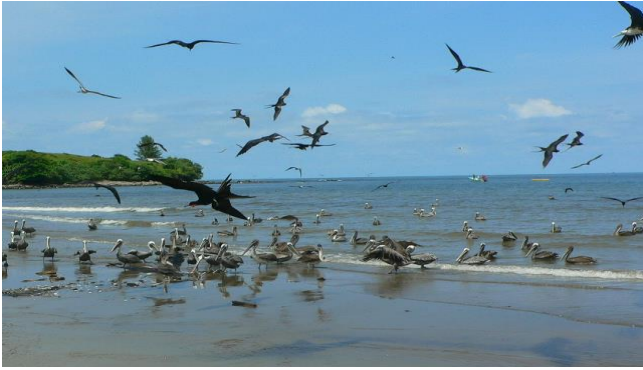
Brown Pelicans en Magnificent Frigatebirds bij Laguna Sontecomapan