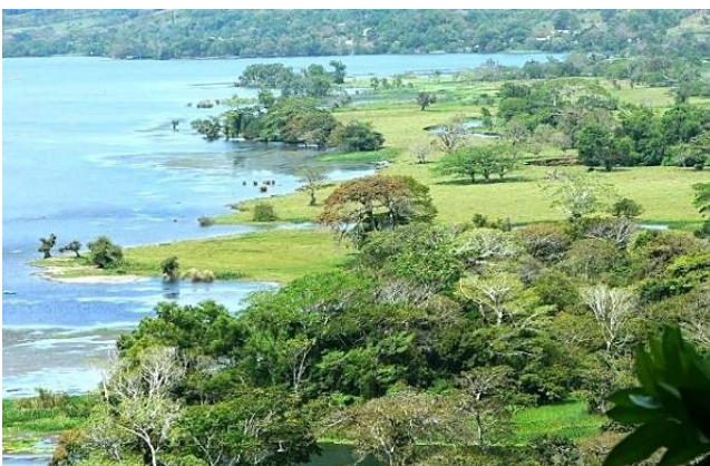
aan de oevers van het meer van Catemaco

Stichting Vogelreizen adviseert om o.m. het volgende mee te nemen: verrekijker (lieftst vergroting van 10x of meer) en, indien in uw bezit, 'n telescoop!, zodat u zelf goede en gedetailleerde beelden kunt krijgen van de waargenomen vogels, camera/telelens, een goede vogelgids, kleding voor vooral warm weer, open wandelsandalen, wandelschoenen, zitmatje, drinkbeker, parapluutje, zonnebrandmiddel, hoofddekseel en mobiele telefoon.