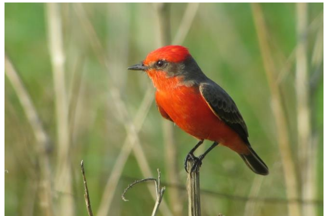
Vermillion Flycatcher bij Tlacotalpan, Laguna de Alvarado