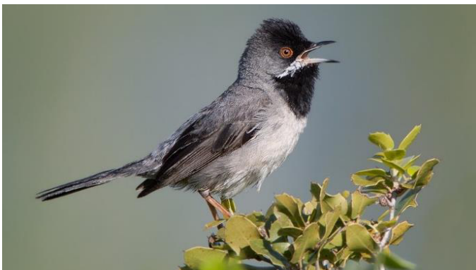
Rüppells Grasmus bij Molivos

Tijdens eerdere reizen van Stichting Vogelreizen ontdekten we: Kaspische Toornslang, Gestreepte Ringslang, Moorse Landschildpad, Kaspische Beekschildpad, Groene Kikker, Boomkikker, Groene Pad, Reuzensmaragdhagedis, Scheltopusik (de Pantserhazelworm, de langste pootloze hagedis ter wereld), Europese Tjiktjak, Hardoen, Gele Schorpioen, Steenmarter, Kaukasuseekhoorn en Oostelijke Egel. Helaas zullen we enkele van deze dieren slechts als verkeersslachtoffer tegenkomen.