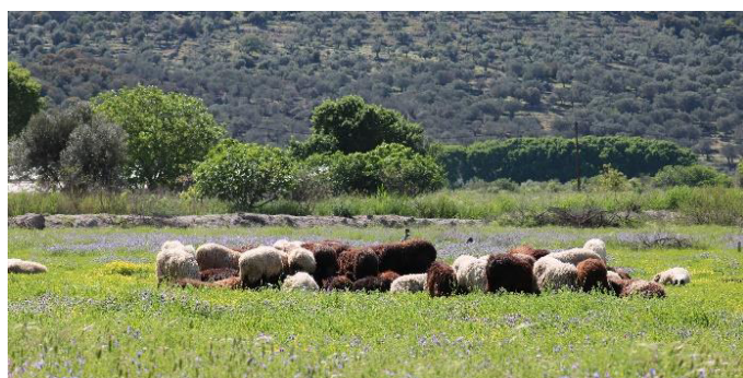
Schape in het onbedorven landschap van Lesbos

In het vliegtuig, de hotelkamer, aan tafel, gedurende veldlunches en in ons busje is roken niet toegestaan.