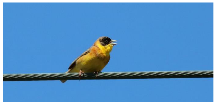
Zingende Zwartkopgors in de Potamiavallei

zijn. Ons hotel ligt centraal op het eiland, aan de rand van het dorpje Skala Kallonis, aan een grote baai én bij een interessant moerasgebiedje.