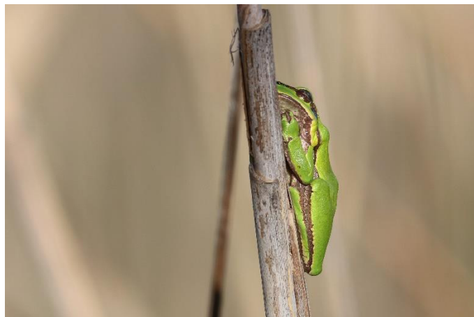
Hier en daar kunnen we de Boomkikker tegenkomen