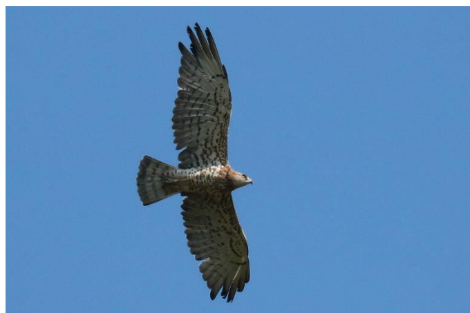
Slangenarend tijdens onze wandeling door de Potamiavallei