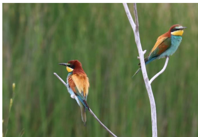
De eerste Bijeneters van dit voorjaar op Lesbos

We vertrekken vanaf Amsterdam/Schiphol-Airport naar Lesbos, vanwaar we naar ons hotel vervoerd worden, rustig gelegen aan de baai van Kallonis, centraal op het eiland. Op welk tijdstip onze chartervlucht vertrekt is nog niet bekend. In de namiddag staat een wandelexcursie geprogrammeerd. Deze activiteit is uiteraard afhankelijk van het tijdstip van aankomst op het eiland. Tijdens deze oriëntatietocht kun je mogelijk al soorten zien als Ralreiger, Zwarte Ibis, Slangenarend, Strandplevier, Krombekstrandloper, Alpengierzwaluw, Roodstuitzwaluw, Grauwe Klauwier en Europese Kanarie. Bij de start van deze reis ontvangen belangstellenden een speciaal op dit reisdoel toegesneden waarnemingenlijst. Hierop kan bijgehouden worden welke soorten zijn gezien of gehoord. 's Avonds wordt de lijst met 'de liefhebbers' gezamenlijk ingevuld. Het aantal vogelsoorten tijdens deze reis kan meer dan 100 bedragen.