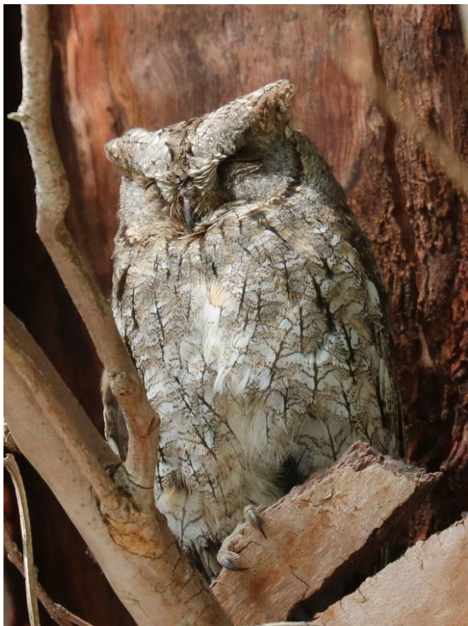
De Dwergooruil rust overdag: 'tsja, wie 's nachts uit 'vissen' gaat, moet overdag zijn netten drogen . . . .'

vogelsoorten verwachten in de diverse landschappen: Dodaars, Kwak, Zwarte Wouw, Arendbuizerd op trek, Torenavalk, misschien al de prachtige Eleonora's Valk, Zomertortel, Alpengierzwaluwen op trek, Oever- en Huiszwaluw, Blauwe Rotslijster, Baardgrasmus, Rüppells Grasmus en Bonte Kraai.