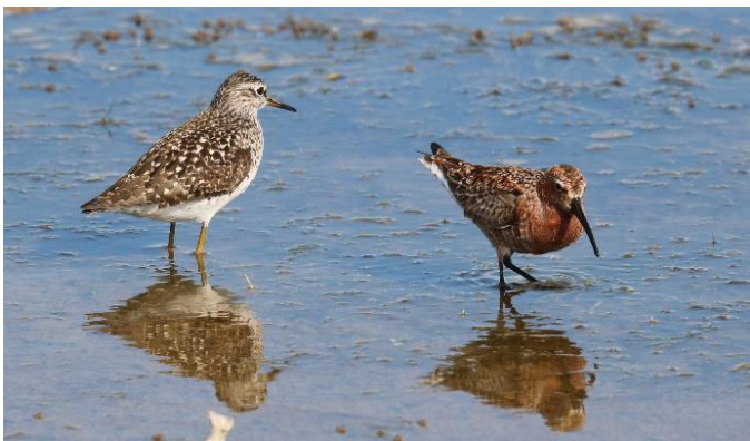
Bosruiter en Krombekstrandloper langs de zoutpannen

genieten en observeren. Er zijn enkele excursiedoelen met een pittige, steile wandeling. Het ontbijtbuffet staat iedere ochtend klaar in ons hotel. Lunches worden in het veld gebruikt, nadat ingrediënten hiervoor 's ochtends vers zijn ingekocht.