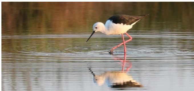
Regelmatig zien we de Stelkluit

komen we langs het hotel en kun je besluiten een dagdeel vrij te nemen. Anderen gaan door met het verkennen van de noordwestelijke kant van de baai van Kallonis. Wat deze trip ons brengen zal is niet te voorspellen . . .