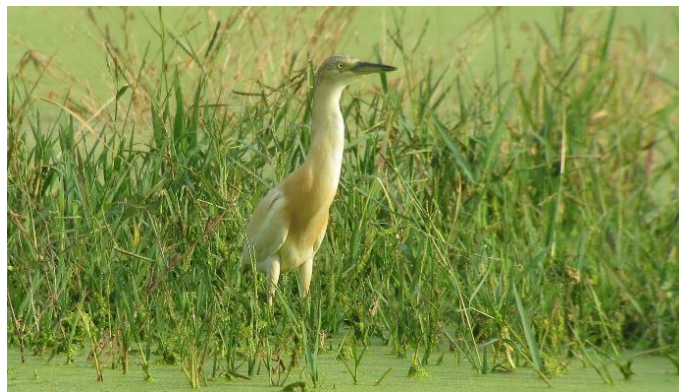
Ralreiger in het moeras bij het hotel

Je lichamelijke gezondheid dient dusdanig te zijn dat je vele dagen achtereen, zonder problemen voor jezelf of voor anderen, aan de excursies kunt deelnemen.