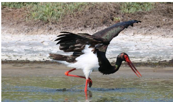
Foeragerende Zwarte Ooievaar bij de zoutpannen

In het zuidoostelijke deel van het eiland gaan we een boswandeling maken door flink geaccidenteerd terrein. Het kan ons soorten opleveren die we elders op het eiland niet of niet makkelijk zullen kunnen zien: Roodborst, Zanglijster, Wespendif, Winterkoning, Boomkruiper, Appelvink en Wielwaal. Verder gaat de excursie naar de berg Olympos. Onderweg proberen we de Turkse Boomklever waar te nemen. De Olympos bedwingen we weliswaar grotendeels gemotoriseerd, maar bijna bij de top kunnen we de laatste honderden