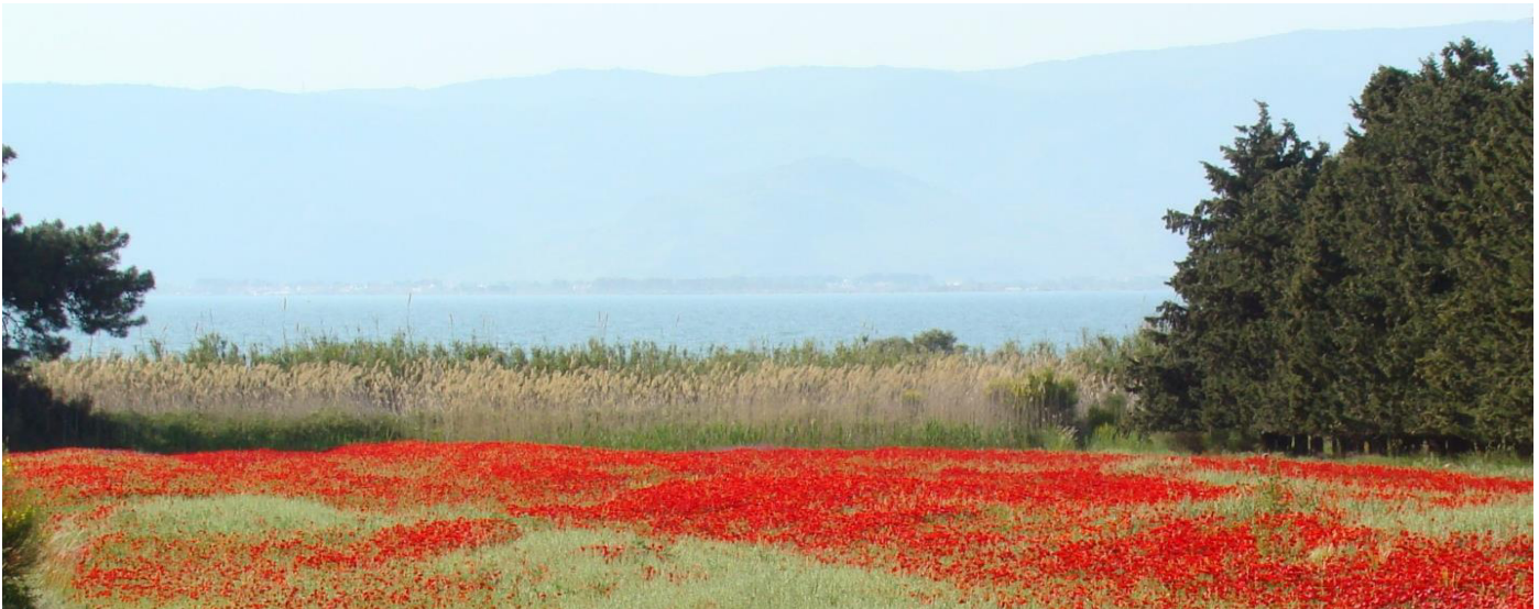
Voorjaarslandschap rond de baai van Kallonis, Lesbos