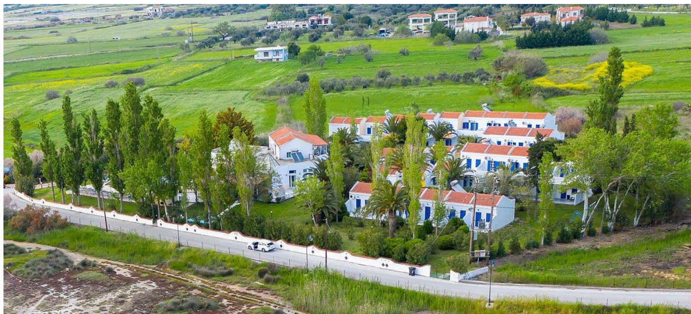
Ons prachtig gelegen hotel op Lesbos: aan de baai van Kalloni