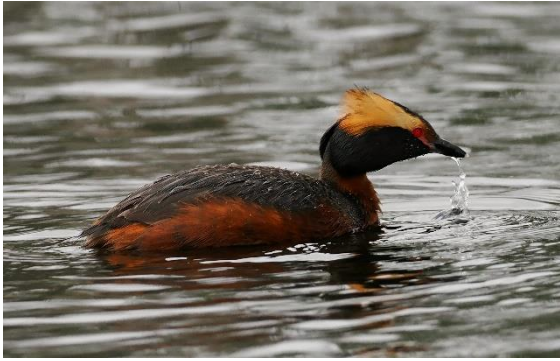
Kuifduiker: foto: Michel Kuijpers

Vandaag gaan we richting Storsjö en Kyrktjärn. Een erg gevarieerd gebied met grote meren, akkers en uiteraard weer veel bos. Een van de meertjes herbergt meestal leuke broedende soorten als Kuifduiker, Dwergmeeuw en Noordse Stern.