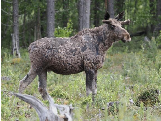
Eland: foto: Michel Kuijpers

Onderweg is er ook altijd kans op zoogdieren. De dichtheid hiervan is niet heel hoog, zodat gericht zoeken moeilijk is. Maar we zijn best veel tijd 'onderweg' op deze reis, het is immers een groot gebied, en de reistijd is tevens vogel- en zoogdier-tijd. Zo is er kans op o.a. Eland, Rode Vos en met veel geluk zelfs Europese Bruine Beer.