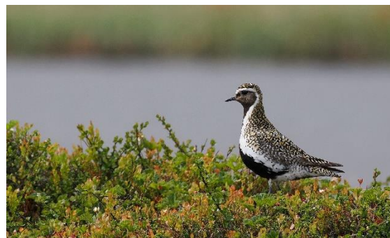
Goudplevier, foto: Michel Kuijpers