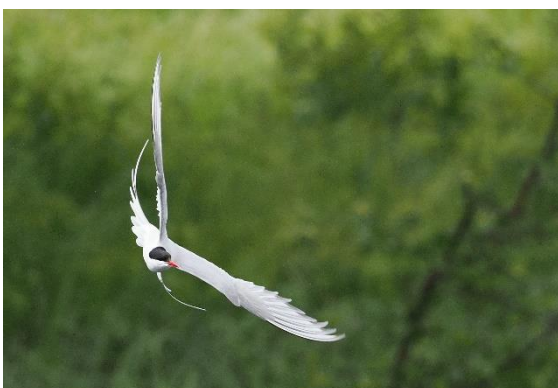
Noordse Stern