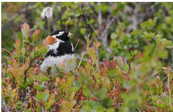
IJsgors, foto: Michel Kuijpers

Het beroemdste vogelgebied in de regio. Het is een hoogvlakte van net iets onder de 1000 meter boven zeenniveau. Dit gebied bestaat uit een begroeiing van dwergberk, kruipwilg en veel besdragende, lage struikjes. De vogels zijn niet altijd eenvoudig te vinden, maar er zijn er veel. Broedvogels zijn o.a. Bonte Strandloper, Bontbekplevier, Morinelplevier, Poelsnip, Watersnip, Kleinste Jager, IJsgors, Kempmaan en Grauwe Franjepoot. Het gebied wordt omringd door hoge, besneeuwde bergen waaronder de Helags, een van de hoogste bergen in de omgeving.