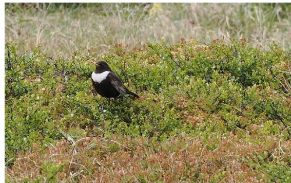
Beflijster: foto: Michel Kuijpers

Vandaag bezoeken – wanneer het weer meewerkt - Torkilstöten en Stortjärnen. Dit is een hooggelegen gebied, waar het weer erg grimmig kan zijn, dus we moeten even zien of het weer voldoende meewerkt. Na een pittige klim wacht een prachtige hoogvlakte met een fantastisch uitzicht op de omringende bergen. Soorten die hier te verwachten zijn, zijn Beflijster, Paapje, en b.v. Alpen- en Moerassneeuwhoen.