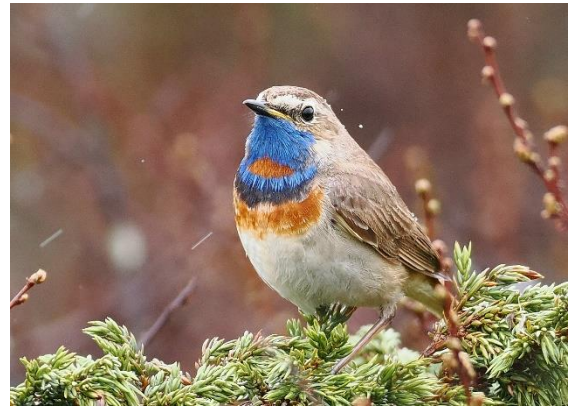
Roodsterblauwborst, foto: Michel Kuijpers