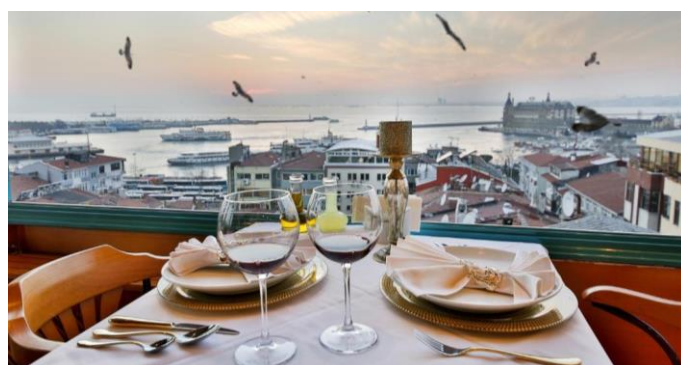
Uitzicht over de Bosporus, vanuit ons hotel

Daarvoor ga je dan even met de pont naar de overkant. Te denken valt aan de Blauwe Moskee, het Topkapı Paleis, de Ayasofya Moskee, de Gouden Hoorn en natuurlijk de Grand Bazaar. Op de vele pleintjes en terrasjes kan je genieten van een verkoelend drankje. Overigens wordt in de directe omgeving van een moskee geen alcoholische drank geschonken.