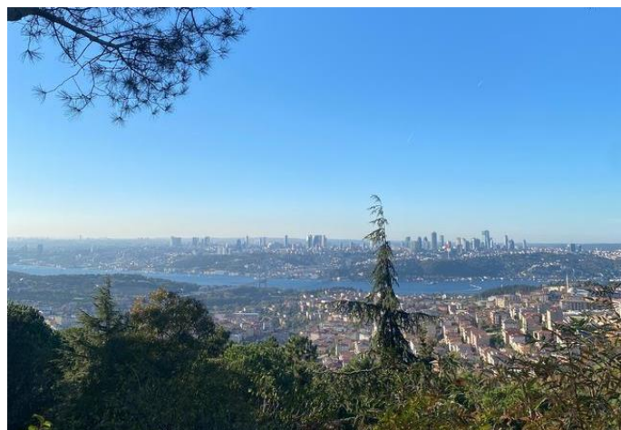
Ons uitzicht vanaf de Çamlica-heuvels

De dagen naar de Çamlica-heuvels zijn weerafhankelijk: bij heel slecht weer zal er een alternatief worden aangeboden.