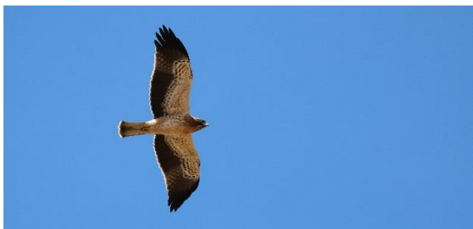
Eén van de vele Dwergarenden die ons passeren

Op gunstige dagen kan de roofvogelmigratie worden waargenomen met wel duizenden vogels per dag, met o.a.: Wespendif, Dwergarend, Schreeuw- en Bastaardarend, Balkan- en gewone Sperwer, Buizerd, Aasgier, Keizerarend en Slangenarend. Kiekendieven kunnen minder vaak worden waargenomen. Op de heuvels worden we dagelijks verrast met kleine zangvogels die in de nacht de oversteek hebben gemaakt: Kleine Zwartkop, klauwieren en vliegenvangers. Boven de stad zien we: Gierzwaluw, Vale Gierzwaluw en Alpengierzwaluw, Palm- en Zomertortel. Boven de Bosporus vliegen dagelijks honderden Yelkouan Pijlstormvogels heen en weer tussen de