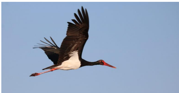
Zo laag komt de Zwarte Ooievaar zelden over!

Vanaf de zuidkant van de Bosporus zien we dan de vogels vanuit noord - en oost Europa ons tegemoet komen.