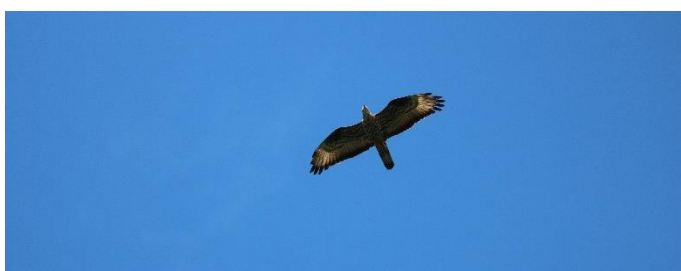
Eén van de overvliegende Wespddieven

Istanbul, met meer dan 18 miljoen inwoners, is de grootste stad van Europa. Het ligt op de grens met Azië en heette voorheen Byzantium en daarna Constantinopel. De stad ligt aan de noordelijke oever van de Zee van Marmara, aan beide zijden van de Bosporus. Het heeft hierdoor zowel een Europees als Aziatisch deel. Het Marmaray-project, een spoortunnel onder de Bosporus, verbindt beide continenten. En er zijn ook grote hangbruggen én natuurlijk de zeer frequent varende ponten. Istanbul is een van de belangrijkste knooppunten voor transport en logistiek op internationaal en nationaal niveau. In het Aziatische deel liggen de heuvels de Kleine en Grote Çamlica. Hiervandaan observeren wij vrijwel dagelijks de zuidwaartse najaars-vogeltrek. Die trekt iedere herfst grote aantallen vogelaars. De tweede helft van september is een prima periode om de vogeltrek optimaal te beleven.