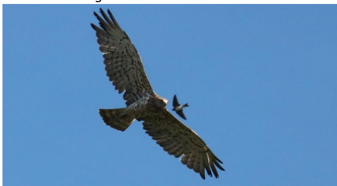
Een mooie Slangenarend vliegt langs

In tegenstelling tot wat gebruikelijk is bij Stichting Vogelreizen zal deze reis niet op basis van volledig pension zijn, maar op basis van logies en ontbijt . De reden hiervoor is dat we dagelijks op een van de Çamlica's ons droogje en natje afhalen bij het lokale restaurant. In de loop van de middag komen we dan terug bij ons hotel, dat in het Aziatische gedeelte van de stad ligt. Zelfstandig kan er dan een bezoek gebracht worden aan het Europese gedeelte van de stad, waar alle bijzondere monumenten zijn en het diner kunnen gebruiken.