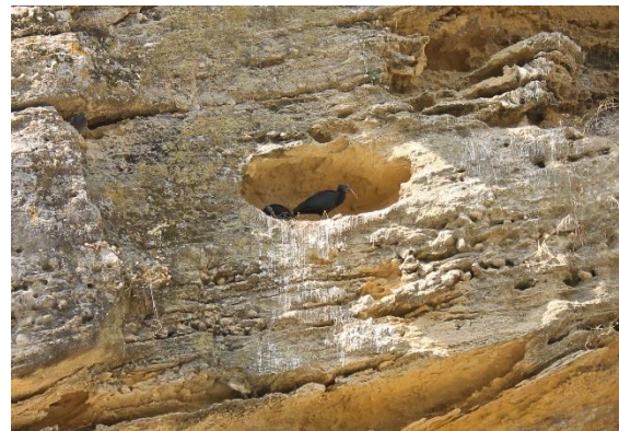
Heremiet- of Kaalkopibis

's- Avonds vieren we de bonte avond in Tarifa.