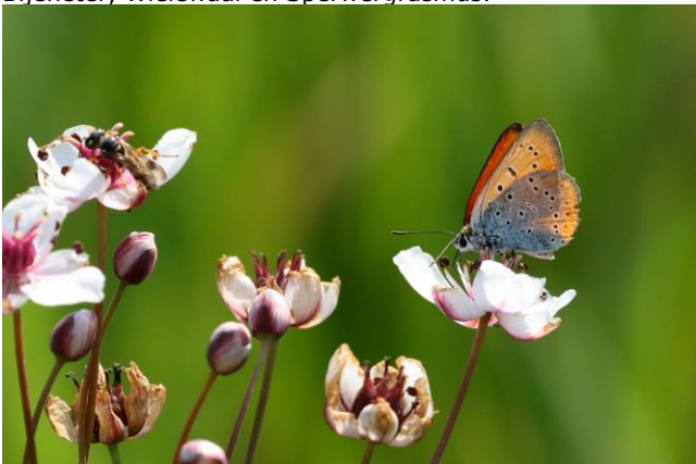
Grote Vuurvliinder

DAG 3 (24 mei) De hele dag vogelen in "Souhata reka" regio. Na het ontbijt vertrekken we naar de rotsachtige kloof van de Souhata Reka (dit betekent "de droge rivier"). Dit is een kalkstenen gebied met verticale kliffen die direct naar beneden lijken te zinken naar de vallei van de rivier. De kliffen zelf zijn geperforeerd door een groot aantal nissen en grotten, die in een ver verleden beschutting gaven aan de vroege christenen in deze landen. Vandaag worden ze bewoond door interessante vogelsoorten, zoals de Zwarte Ooievaar, Slangenarend, Arendbuizerd en Dwergarend. Maar we vinden daar ook een aantal kleinere, niet minder fraaie vogels, zoals Scharrelaar, Hop, Bijeneter, Wielewaal en Sperwergasmus.