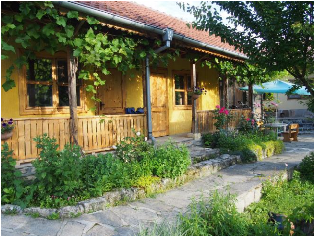
Pelican Lodge; foto: Michel Kuijpers