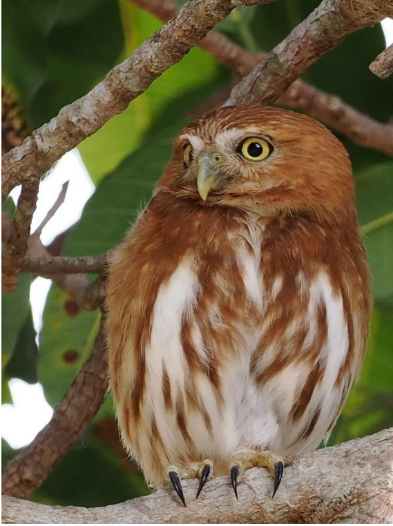
Ferruginous Pygmy Owl