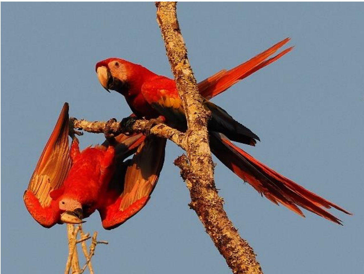
Scarlet Macaw