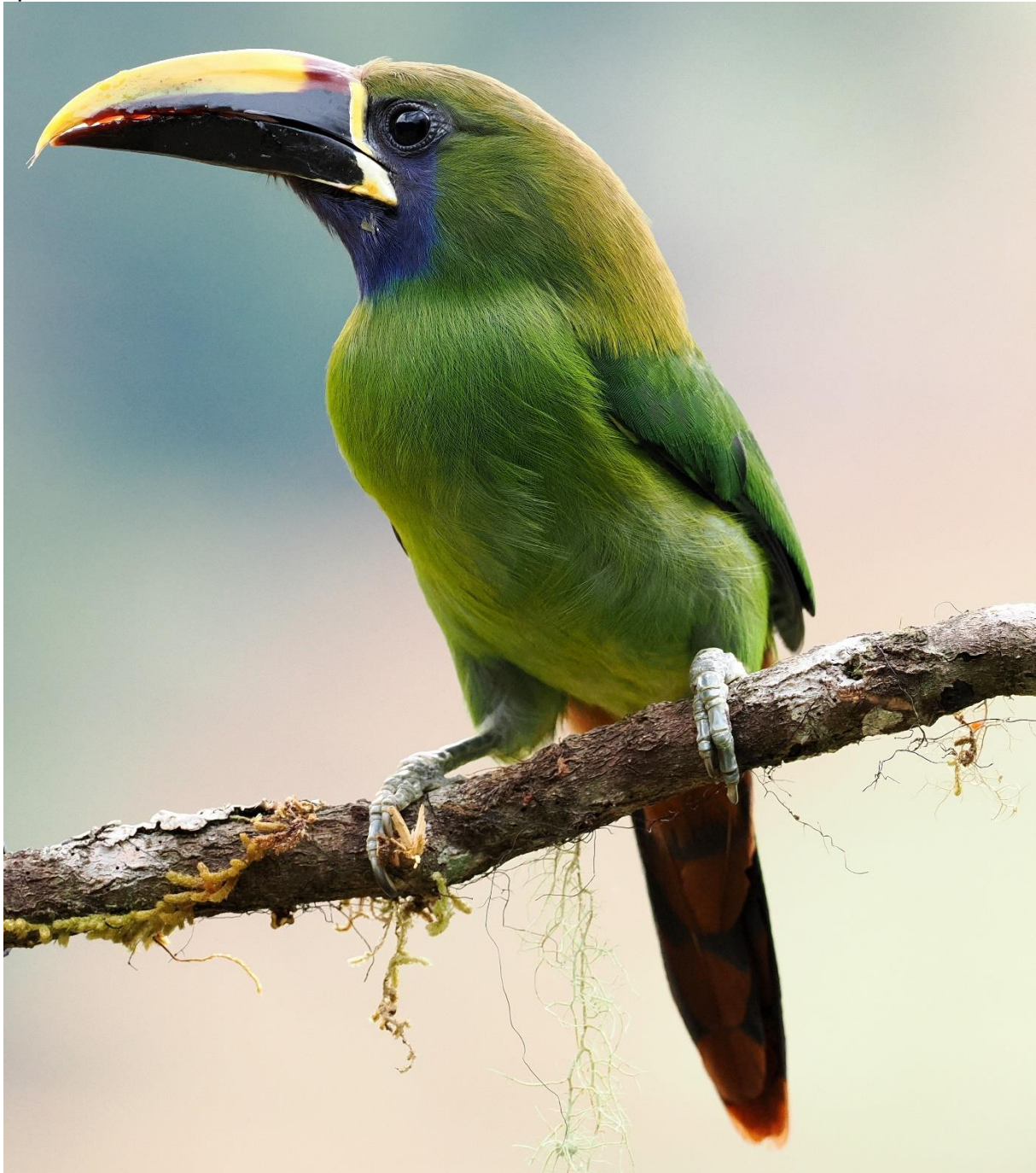
Northern Emerald Toucanet, foto: Michel Kuijpers

Naar Laguna de Lagarto Lodge, onderweg bezoeken we de feeders Cinchona. Hier krijgen we een eerste kennismaking met de kolibries, zoals de endemische Copper-headed Emerald en de Brown Violetear. Daarnaast is er een kans op een erg spectaculaire toekansoort, de Northern Emerald Toucanet.