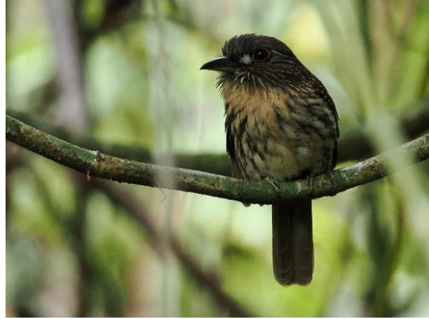
White-whiskered Puffbird