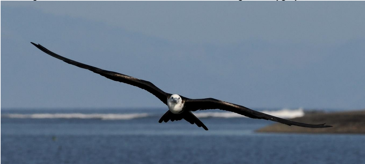
Magnificent Frigatebird juveniel

De tweede volle dag hier besteden we aan een excursie met een lokale gids in het binnenland, met een aantal zeer aansprekende soorten als doel. Denk aan beauty's als Long-tailed Manakin, Pacific Screech-Owl en Ferruginous Pygmy-Owl.