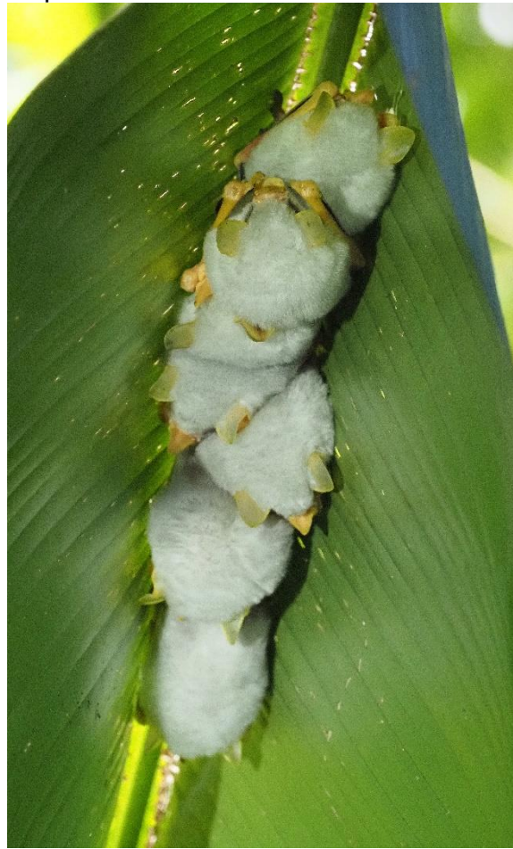
Honduras White Bats

Hij neemt ons mee naar het bos, en zal laten zien waarom een lokale gids hier onmisbaar is. Hij vindt dingen waar wij zonder het zelfs te zien aan voorbij zouden lopen. Hij kent de plekken waar bijzondere soorten zoals uilen en potoos te vinden zijn, maar laat ook pijlgifkikkertjes zien, wijst aan in welke bomen de mieren huizen en weet onder welke bananenbladeren de witte vleermuizen slapen.