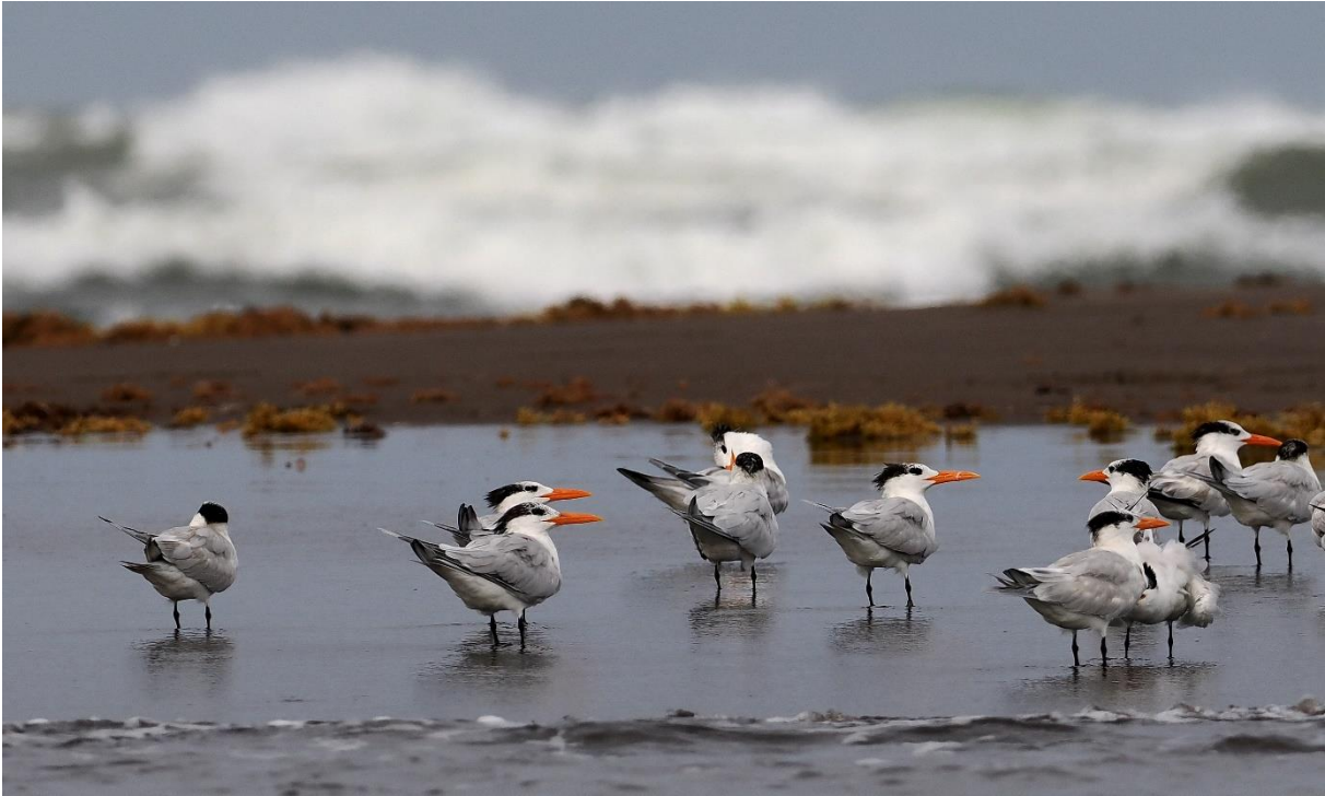
Royal Tern