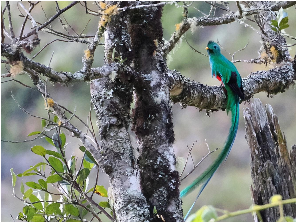
Resplendent Quetzal man

We verruilen de jungle voor het hoogland. En hoog is in Costa Rica echt hoog. Onze lodge ligt op 2650 meter boven zee. Zouden we in Europese bergen op deze hoogte al in de eeuwige sneeuw zitten, hier dichtbij de evenaar is het nog volop bos. Om precies te zijn nevelwoud. Een prachtig bos waar de bomen nog plaats bieden aan talloze andere planten die in die bomen groeien, zoals de meest opvallende; de bromelia's. En deze hoogte brengt een bijna volledig nieuwe set aan vogelsoorten. Met name de kolibries zullen hier iedereen betoveren, maar ook prachtige soorten als Long-tailed Silky Flycatcher, de Golden-browed Chlorophonia en de Flame-coloured Tanager zijn hier thuis. Maar de ster van de show in het hoogland is natuurlijk de legendarische Resplendent Quetzal. We spenderen drie nachten op deze plek om onze kansen op de hooglandsoorten te maximaliseren.