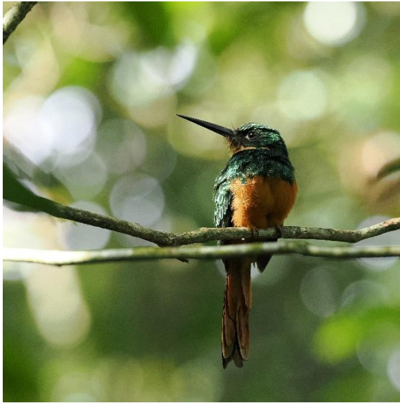
Rufous-tailed Jacamar, foto: Michel Kuijpers

tailed Jacamar. Maar ook meerdere soorten spechten, de White-whiskered Puffbird en wellicht ook apen.