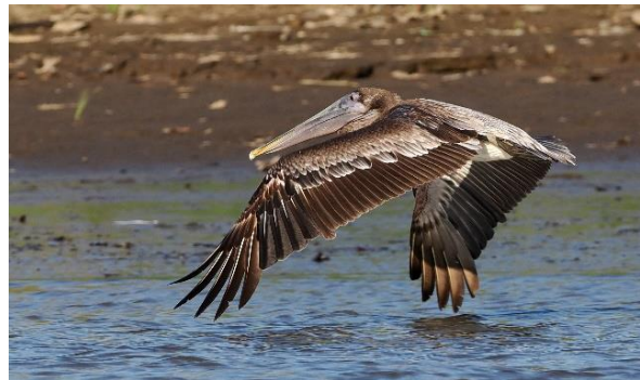
Brown Pelican, foto: Michel Kuijpers