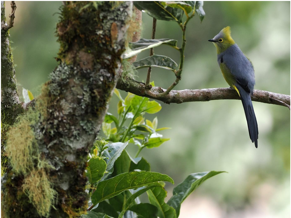
Foto-avontuur in Costa Rica

organiseert een 16 daagse foto- en natuurreis