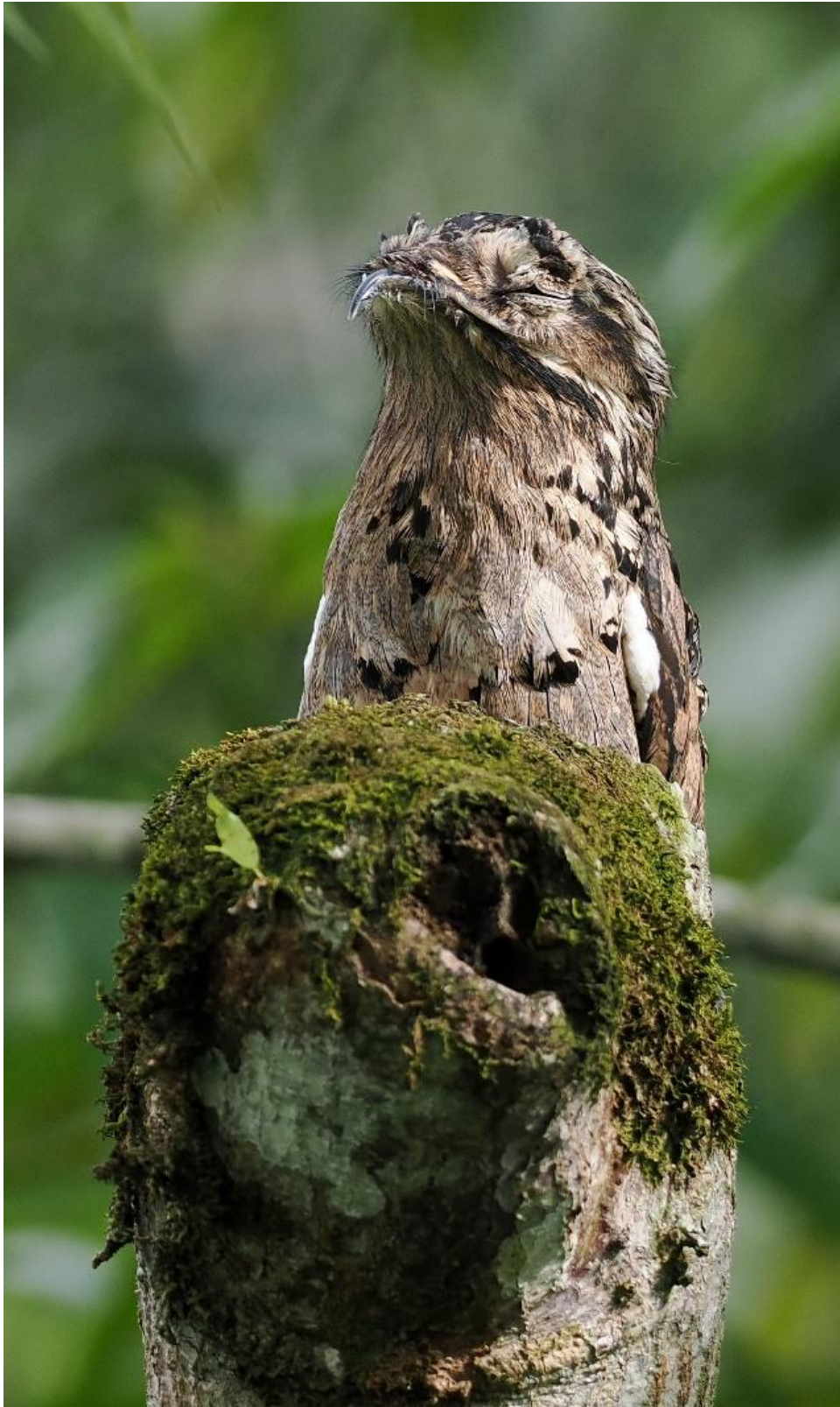
Common Potoo, foto: Michel Kuijpers

In dit gebied bezoeken we ook de Pierella Gardens. Geen tuin maar feitelijk een stuk herbebost land, maar heel veel fraaie vogelsoorten te zien zijn, zoals b.v. de Rufous-