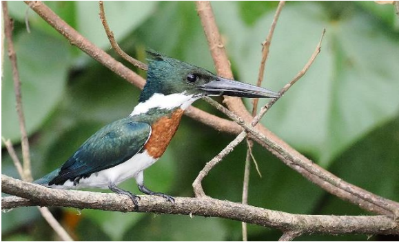
Amazon Kingfisher