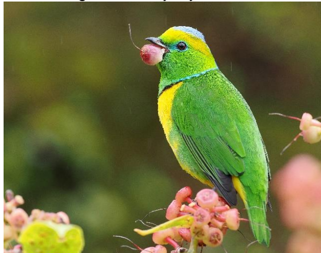
Golden-browed Chlorophonia, foto's: Michel Kuijpers