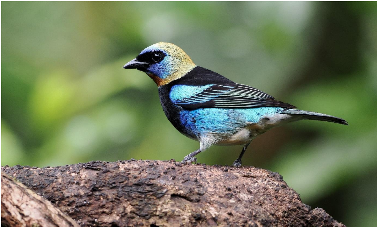
Golden-hooded Tanager.

Een bestemming in de jungle waar naast veel fruit-etende soorten, een fotohut is aangelegd speciaal voor de King Vulture, de meest spectaculaire gier van Costa Rica.