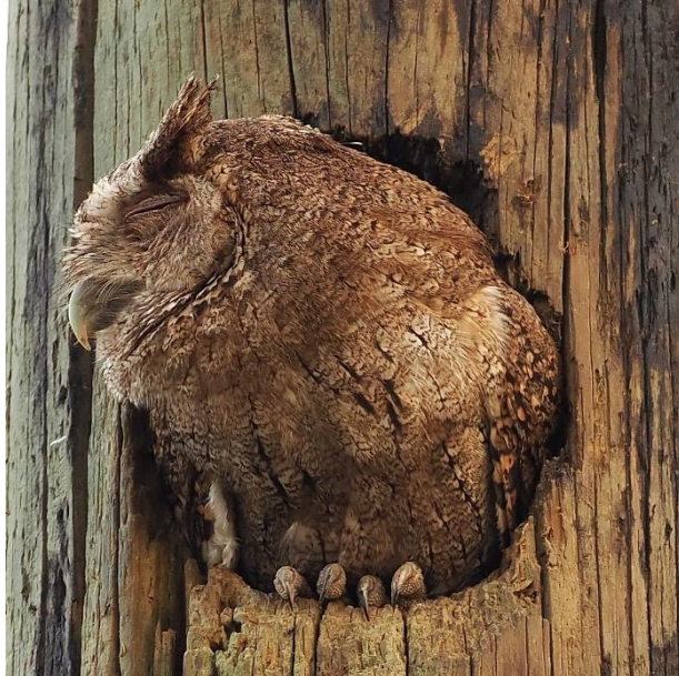
Pacific Screech-Owl