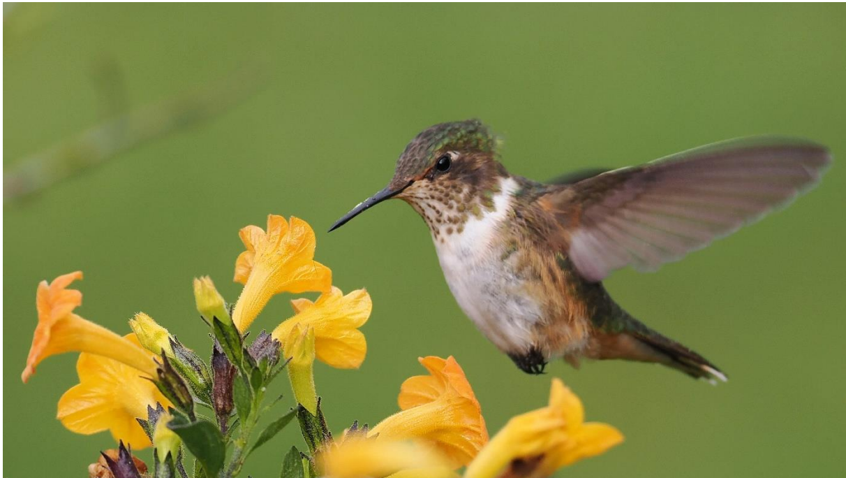
Volcano Hummingbird vrouw