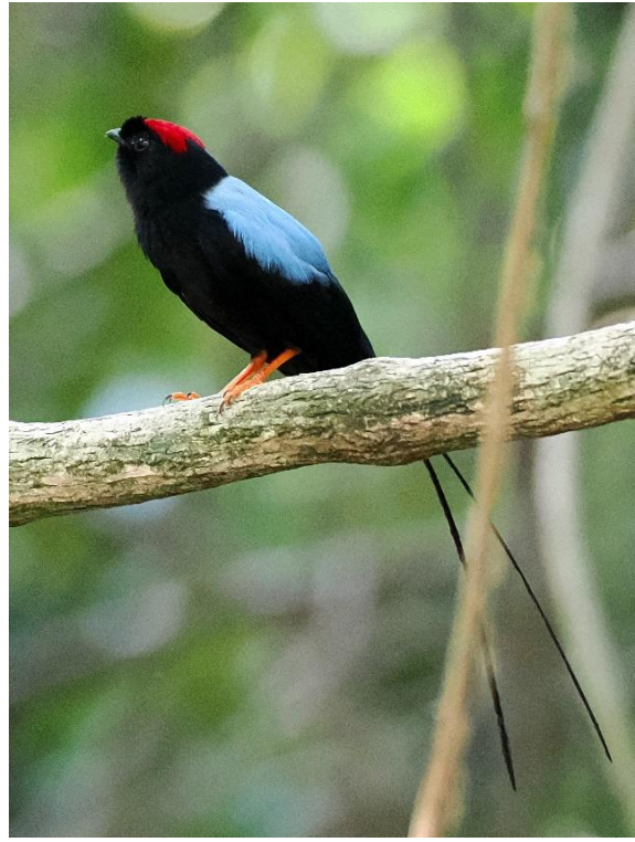
Long-tailed Manakin