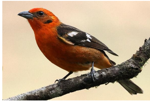
Flame-coloured Tanager