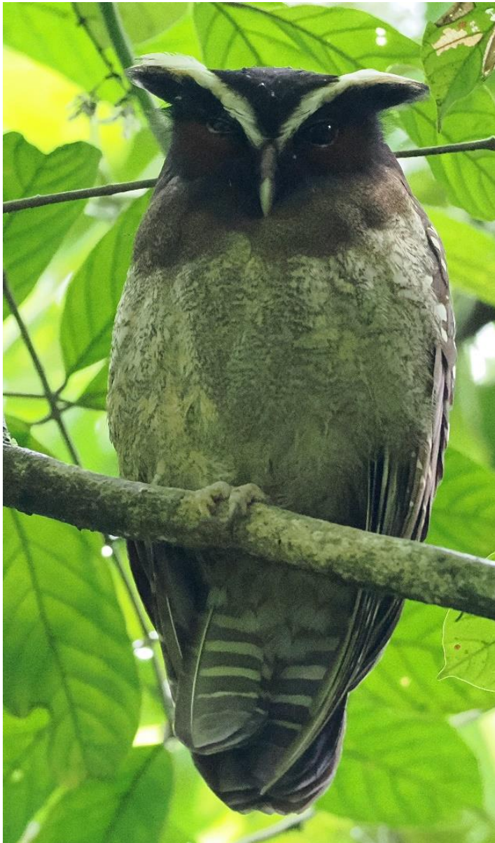
Crested Owl

Hij neemt ons mee de jungle in op zoek naar specialiteiten zoals uilen en met wat geluk de zeer bijzondere Great Potoo.