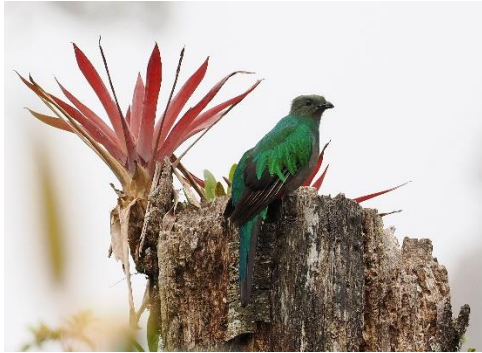
Resplendent Quetzal vrouw