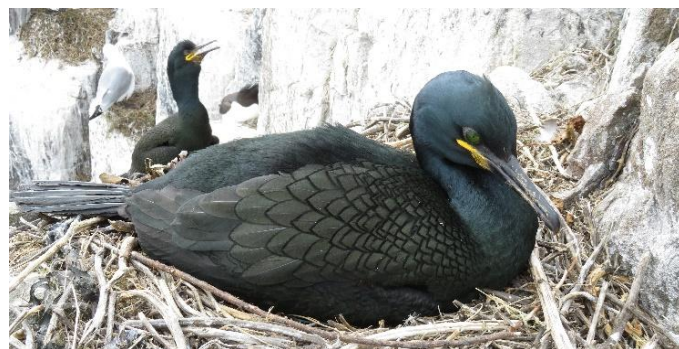
Kuifaalscholver met op de achtergrond Drieteenmeeuw en Alk (ED)

dag 7 t/m 9: Op één van deze dagen hebben we een 'vrije ochtend'. We gaan volop genieten van natuur en landschap in deze polaire en zeer dun bevolkte uithoek van Noorwegen. We maken hopelijk een interessante excursie van enkele uren naar en op het vlak voor de kust gelegen vogeleiland Hornøya. Deze tocht kan alléén doorgaan als de weersomstandigheden het toelaten. Op Hornøya bevindt zich een kolonie van o.a.