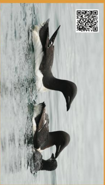
The bird cliffs of Varanger are full of life during the summer months. By mid July young birds leave the cliff. In photo: Brunnichs Gullmots at Homøya.