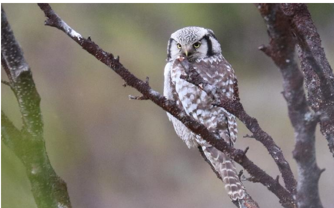
Of we, net als in 2022, de Sperweruil weer gaan ontdekken . . . (ED)

genieten natuurlijk! Tijdens onze excursies naar zeevogelkolonies aan de rand van het Varangerfjord en de Barentszee hebben we fraai zicht op o.a. Drieteenmeeuw, Zwarte Zeekoet, Kortbekzeekoet en gewone Zeekoet, Papegaaiduiker, Zeearend en Kuifaalscholver. Daarnaast bezoeken we in Pasvik gebieden waar we grote kans maken op prachtige broedvogelsoorten als Wilde Zwaan, Visarend, Zwarte Ruiter, Bruinkopmees, Haakbek, Pestvogel en Keep. Er is zelfs een kleine kans op een heuse ontmoeting met beren! Het is duidelijk dat tijdens deze actieve vogelreis het indrukwekkende arctische natuurleven in al zijn facetten ruimschoots 'in beeld' komt. En dat is natuurlijk genieten voor natuurliefhebber, fotograaf en de echte vogelaar!