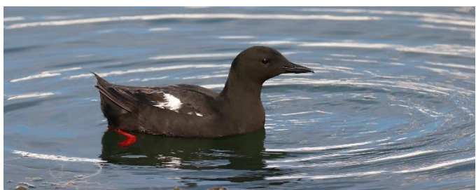
Zwarte Zeekoet aan de rand van de poolzee (ED)

dag 4 en 5: We maken diverse excursies langs de rand van de Barentszee, door de binnenlanden en naar de hooggelegen fjell. Hier zoeken we zingende Koperwieken, roepende Goudplevieren en baltsende IJseenden. Maar ook proberen we om Morinelplevier, Moerassneeuwhoen, Ruigpootbuizerd, Drieteenmeeuw, Grote Burgemeester en Kramsvogel in de kijker te krijgen. Op de toendra zijn nog grote gedeelten met sneeuw bedekt en misschien komen we zelfs wel in een sneeuwbus terecht! De meertjes zijn nog maar gedeeltelijk ijsvrij. Toch verblijven er al Roodkeelduikers in de open stukken. Gras- en Roodkeelpieper, Kleinste Jager, Morinelplevier, Strandleeuwerik, Koperwiek of Tapuit kunnen we óók tegenkomen op de uitgestrekte hoogvlakten. Veel geluk moeten we hebben om een Sneeuwuil of Poolvos te zien. Turend over de Barentszee proberen we Koningseider en Stellers Eideend te ontdekken. Die hangen in het voorjaar hier nog wel eens in groepjes rond, voordat ze naar hun Siberische broedgebieden terug vliegen. En misschien nemen we de Geelsnavelduiker wel waar tussen de golven . . .