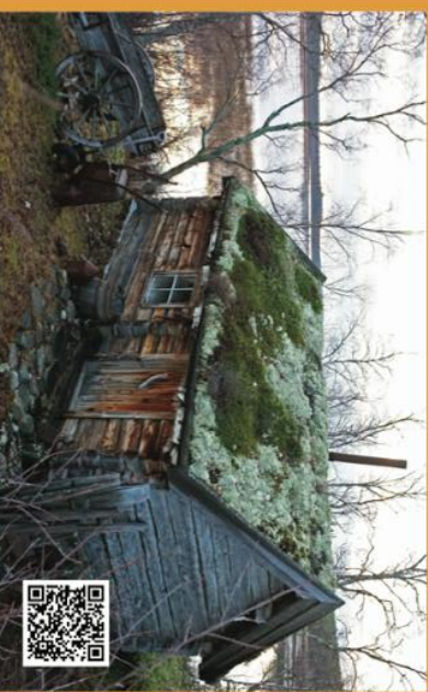
The Pasvik Taiga is worth visiting any time of the year. Here you can find breeding Little Buntings, Siberian Tits, Siberian Jay, Pine Grosbeak and many other species.