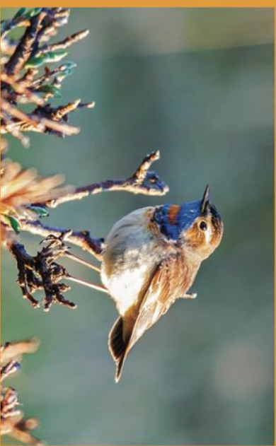
The Bluethroated, another Arctic jewel commonly found in Varanger. It is also known as the nightingale of the north. Nesseby and the areas around the nature reserve is a good place to look for Bluethroats.