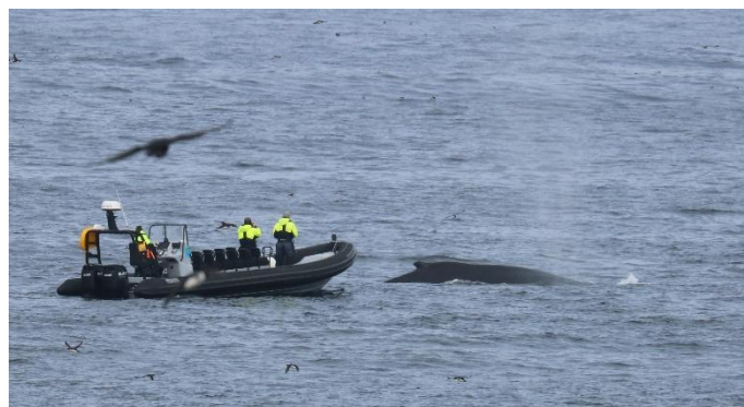
Onze excursieboot voor whale watching op de Barentszee (ED)

whale watching vanuit Vardø kan met een RIB (rigid inflatable boat; zie foto) een whale watching excursie gemaakt worden op de Barentszee. De kans is groot dat we Bultruggen en misschien Orka's van dichtbij kunnen waarnemen. De prijs in 2024 was € 100,- pp; deze bijzondere excursie is alleen 'voor de liefhebbers', duurt 2,5 uur en vindt plaats op onze 'vrije ochtend' op dag 7, 8 óf 9.