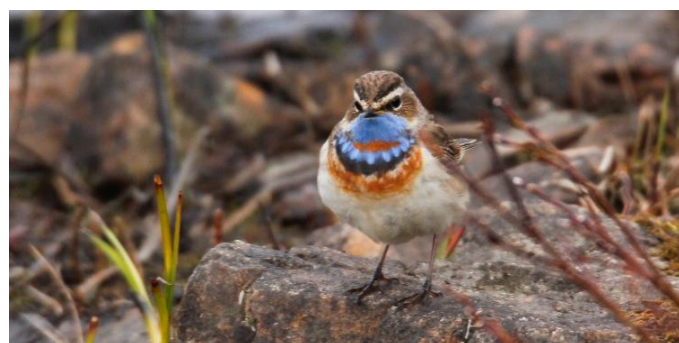
Roodgesterde Blauwborst bij Hamningberg (RH)

Een onderzoek van de uitgestrekte toendra staat deze dagen natuurlijk op het programma, maar óók: een ontdekkingsstocht naar het haast uitgestorven, historische Hamningberg, wandelingen door zandduingebieden, langs stranden, beken, moerassen en veengebieden. Tijdens onze excursies kan een