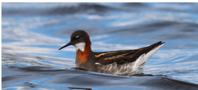
Grauwe Franjepoot bij Nesseby, Varanger (ED)

dag 6: we reizen vandaag van Berlevåg naar de oostkant van Varanger: Vardø. Langs de prachtige, brede rivier de Tana gaan we op zoek naar de nestplaats van de Giervalk. Deze vogel voedt zich bijna uitsluitend met Sneeuwhoeders. Overigens is in deze gebieden een ontmoeting met een Eland niet uitgesloten. De tocht van vandaag voert ons verder langs de zuidkant van Varanger, naar o.a. het schiereilandje Nesseby. Achter het kerkje ligt een mooi plasje waar we rondtollende Grauwe Franjepoten kunnen verwachten. Hier, of bij Vadsø, zien we ze misschien. Ook is er kans op: Eider, Stellers Eider, Noordse Stern, Kempmaan, Bonte Strandloper, Temmincks Strandloper, Kanoet of Strandleeuwerik. Later op de dag bezoeken we de imposante kolonie van de Drieteenmeeuw op het schiereilandje Ekkerøy. Aan het einde van de middag komen we, via de tunnel, in Vardø aan, op het