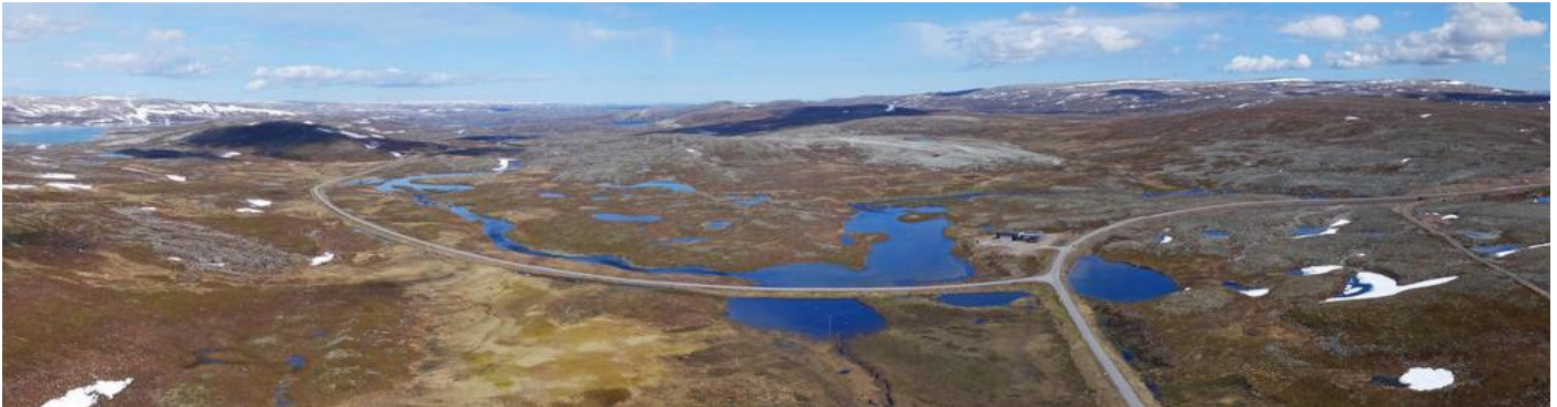
Unieke vogeltochten door de arctische toendra bij Gednje, Kongsjordfjellet, Varanger