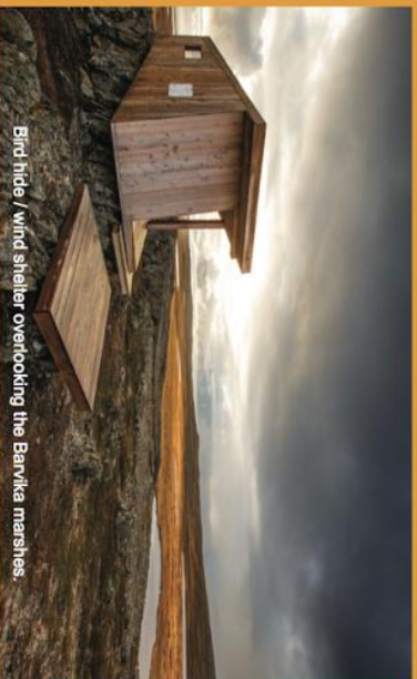
Bird hide / wind shelter overlooking the Barfveka marshes.