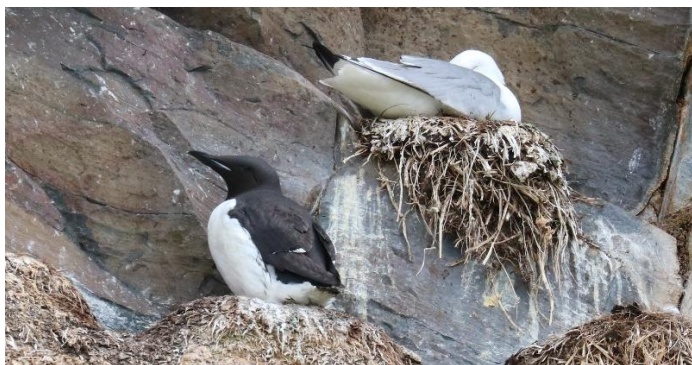
Kortbekzeekoet en Drieteenmeeuw op Hornøya (ED)

Kramsvogel, Koperwiek, Fitis, Raaf, Bonte Kraai, Grote Barmsijs, Frater en Keep. En misschien ontdekken we wel de zeldzame Geelsnavelduiker, Ross' Meeuw of Terekrutter, die wij hier tijdens vorige reizen zagen. Wie weet . . . Sommige hoog noordelijke vogelsoorten zijn zelfs op het Varanger-schiereiland zeldzaam, of komen niet ieder jaar voor of tot broeden, zoals de Ruigpootbuizerd en de Sneeuwuil. Dat heeft vooral te maken met de beschikbaarheid van prooidieren. Onder andere deze vogelsoorten zijn in belangrijke mate afhankelijk van het voorkomen van Lemmingen, Noordse Woelmuizen en andere prooidieren. Niet ieder jaar is een rijk knaagdierenjaar en bovendien kunnen regionale populatieschommelingen optreden.