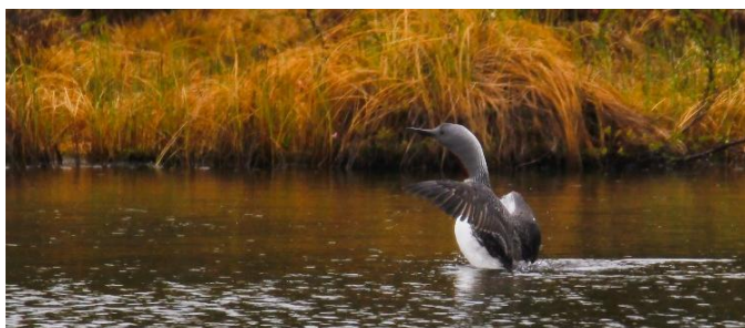
Roodkeelduiker bij Kirkenes (RH)

dag 10 t/m 12: We kiezen vanochtend een zuidelijke koers en gaan vroeg terug, via Kirkenes, naar Svanvik, zo'n 300 km. verderop. We kunnen tijdens de dagtocht vogelsoorten verwachten van de kale toendra op Varanger, tot de dicht begroeide taiga ten zuiden van Kirkenes. In de middag komen we aan in Svanvik. Dat geeft ons de kans om een bezoek te brengen aan natuurgebieden in de directe omgeving. We overnachten drie keer in het Svanhovd Conference Centre van het Visitor Centre Øvre Pasvik National Park in Svanvik, in de uitgestrekte natuur van Pasvikdalen.