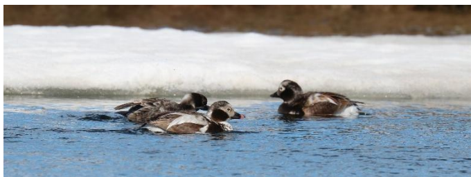
IJseenden op een ijsvrij meertje op de hoge toendra (ED)

Moerassneeuwhoen, Bosruiter, Oeverloper, Koperwiek, Raaf, Bonte Kraai, Keep óf IJsgors. We overnachten drie keer in Berlevåg, direct aan de Barentszee.